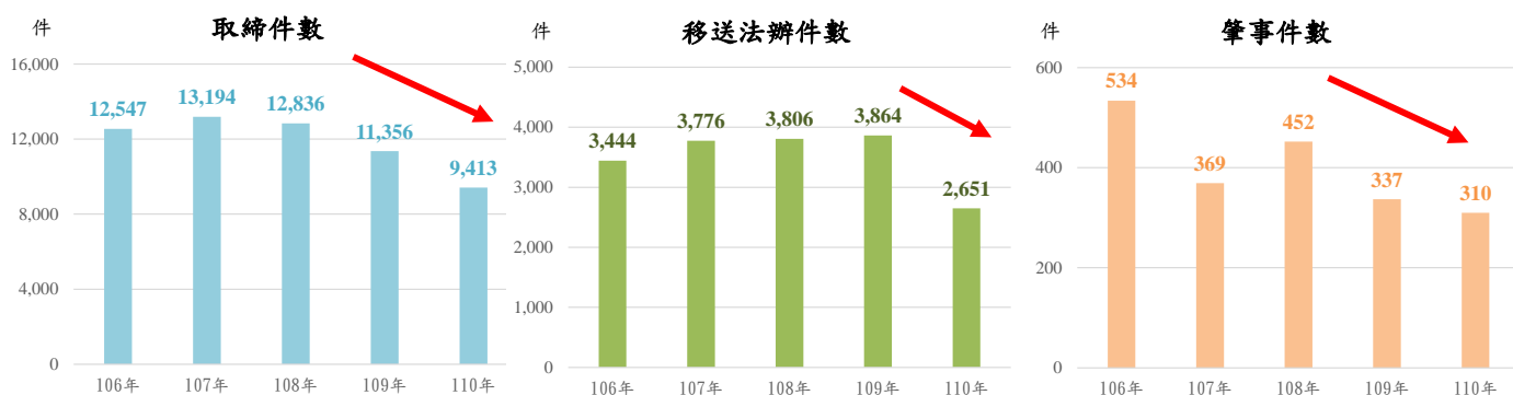
圖 1、高雄市酒駕取締概況

酒後駕車為重大危害交通秩序之行為，屬於公共危險罪，駕駛人之酒測值超過 0.25 毫克或血液中酒精濃度達 0.05% 以上則移送地檢署偵辦，並加重酒駕致人死亡、重傷者之刑責。本市 110 年酒駕取締件數 9,413 件，較 109 年之 1 萬 1,356 件減少 1,943 件(-17.11%)；108 年 7 月道路交通管理處罰條例修正施行，除提高罰鍰外，亦新增連坐處罰及懲罰性賠償，修法後成效逐漸展現，110 年移送法辦 2,651 件、肇事件數為 310 件，分別較 109 年減少 1,213 件(-31.39%)及 27 件(-8.01%)，亦較 108 年減少 1,155 件(-30.35%)及 142 件(-31.42%)。(詳圖 1)