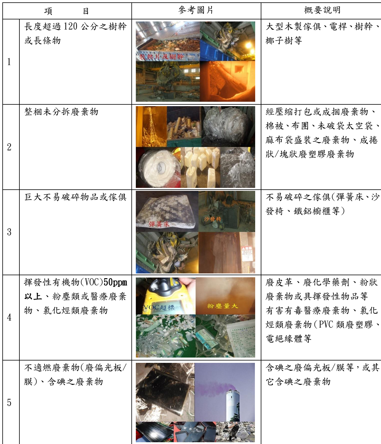
表 2 岡山焚化廠一般事業廢棄物進廠拒收清單