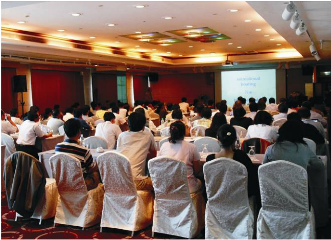
▲研討會會場座無虛席