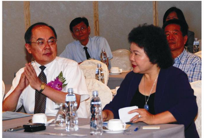
▲高雄市市長與海洋局局長交換意見