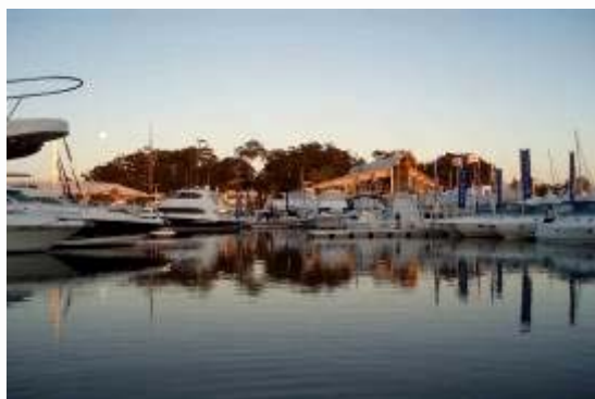
▲ 神仙灣國際遊艇展會場實景