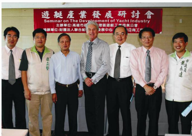
▲研討會結束後與會貴賓合照