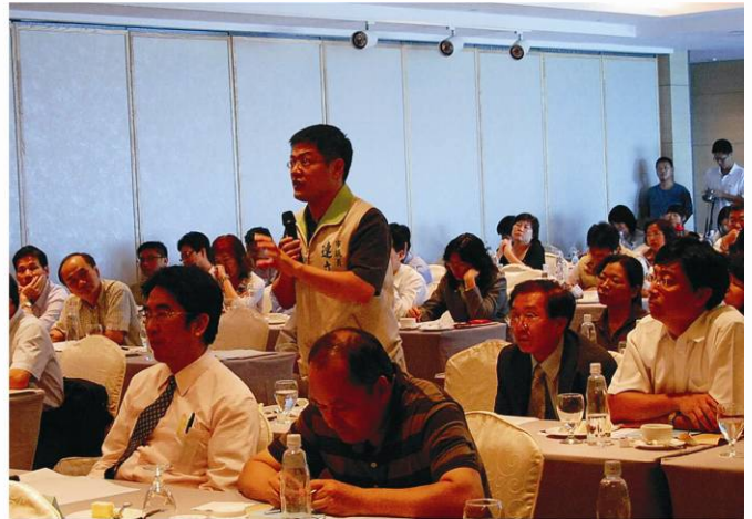
▲連立堅議員發表意見