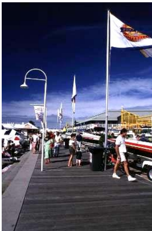
▲ 早期的遊艇展還不夠成熟，無法長期吸引遊客