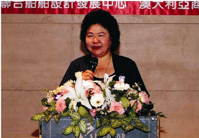
▲高雄市陳菊市長為研討會致詞