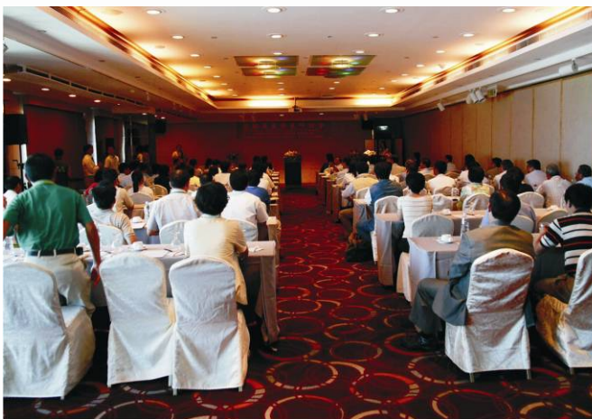
▲研討會會場座無虛席