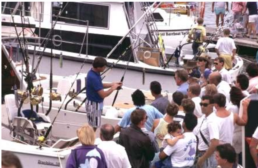
▲ 釣魚是澳洲人最愛的親水活動之一

釣魚也是澳洲人民最大的休閒娛樂活動；澳洲的遊艇業界常引用一個非常古老的故事，一位長者對一位年輕人說：「相信我！絕對沒有別的活動會比在遊艇上更好玩，在遊艇上光是漂來漂去也是相當快樂的。」澳洲人喜歡帶著全家人一同出遊，在遊艇上待一整個下午，釣魚、跳水、享受海洋。現在澳洲遊艇的發展趨勢是，剛入門先買小的，漸漸再買大的；在澳洲遊艇娛樂、休閒，是生活型態的選擇，澳洲人比較親水，容易享受水上樂趣。