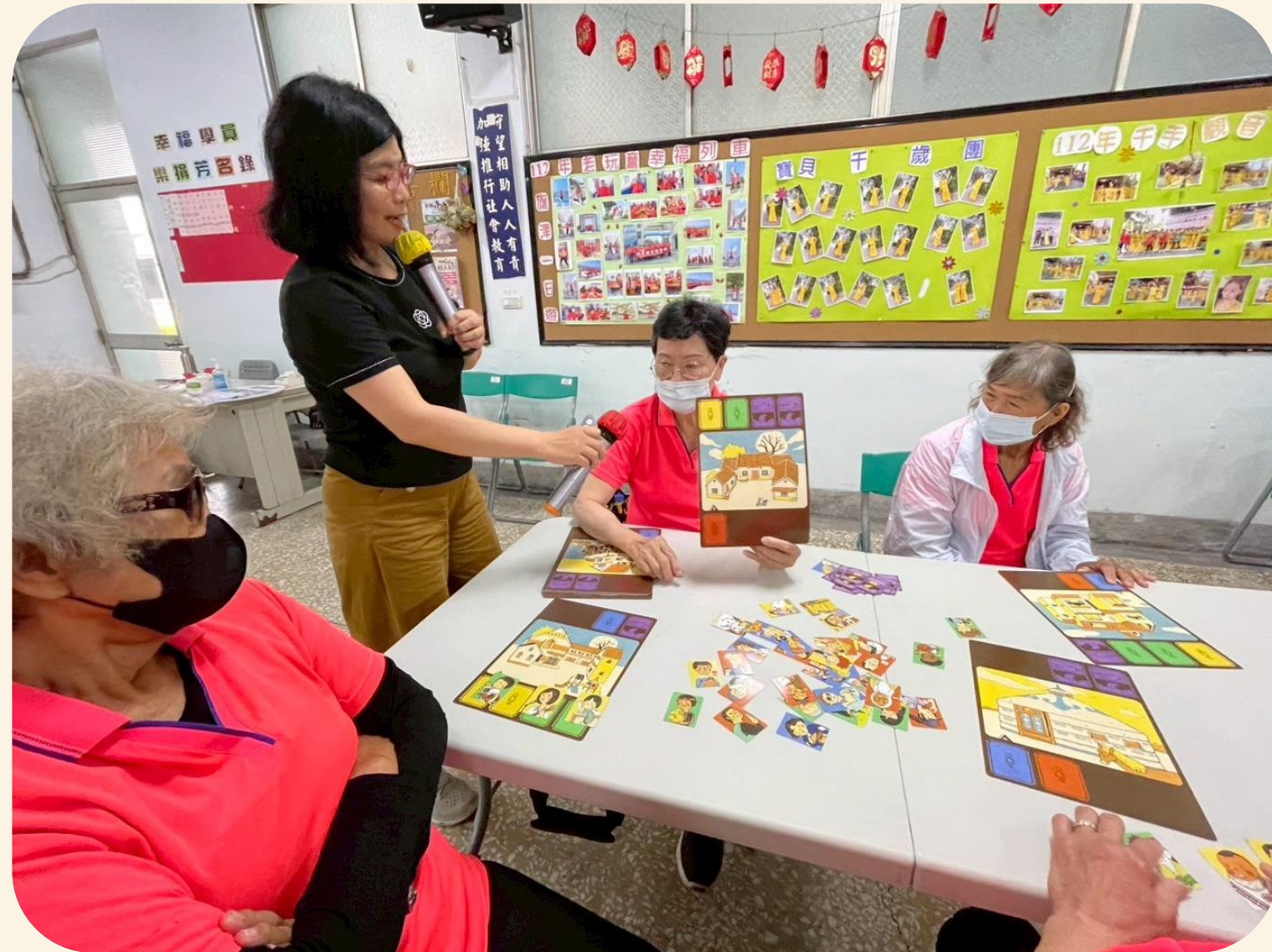
主題桌遊 - 性別三溫暖