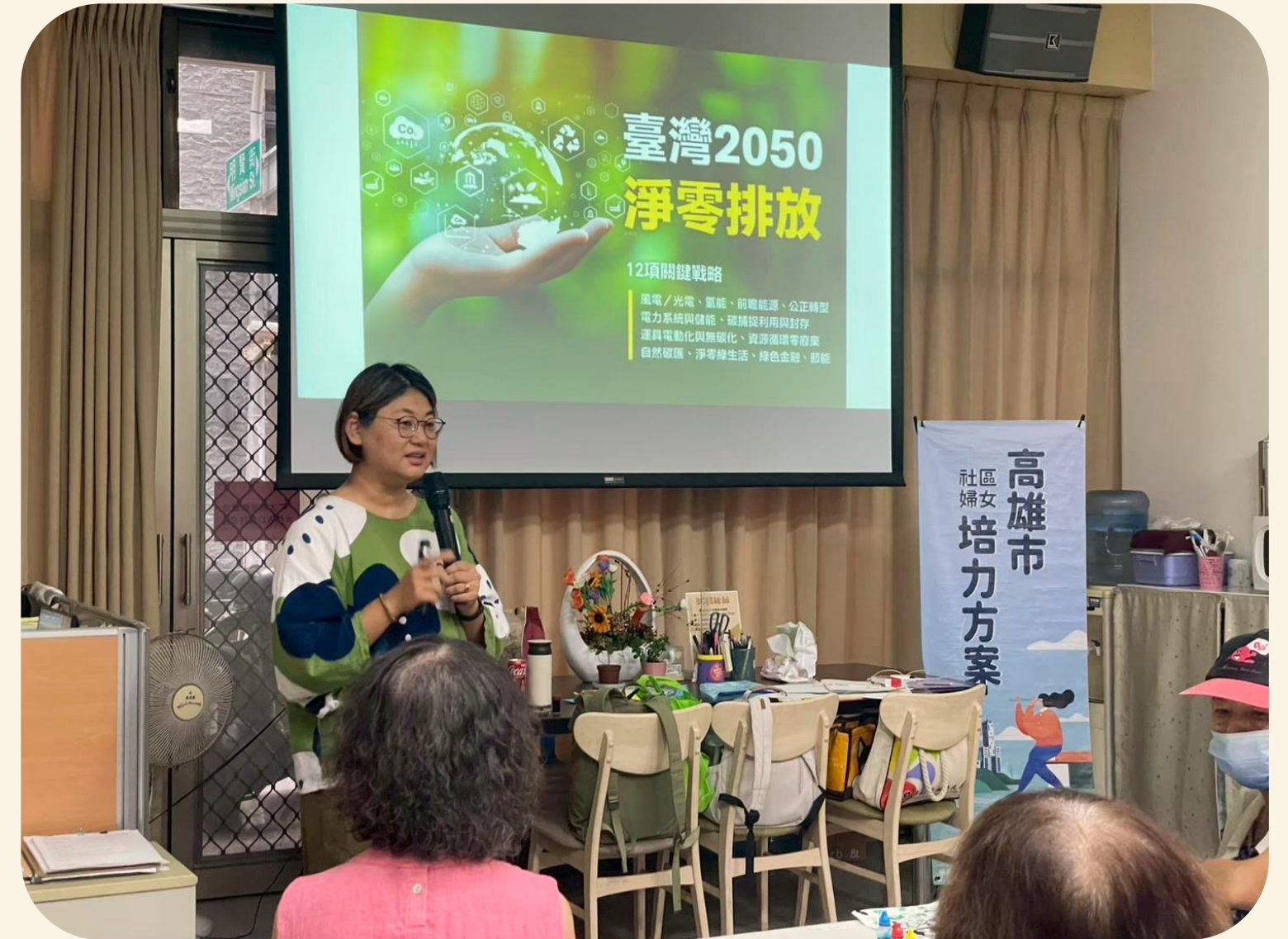
環境永續與友善性別