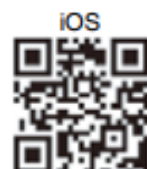
防空避難警政軟體