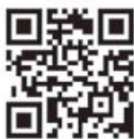
防空避難警政軟體