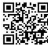
動員召集查詢系統