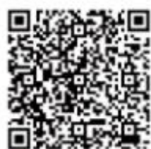
空襲警報聲響識別