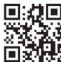
防空避難警政軟體