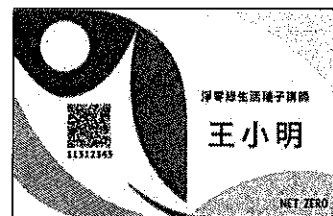
淨零綠生活推廣種子講師證

經本院徵選培訓取得淨零綠生活種子講師證(如右圖),且環境教育人員認證有效資格須涵蓋本活動期間(即日起至113年11月30日)。