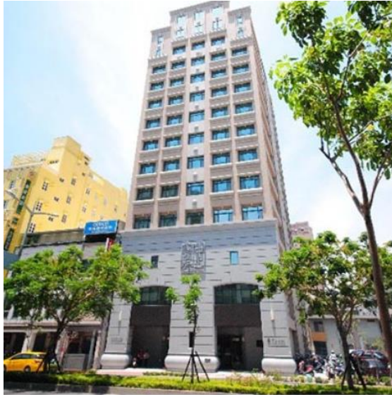
中正脊椎骨科醫院