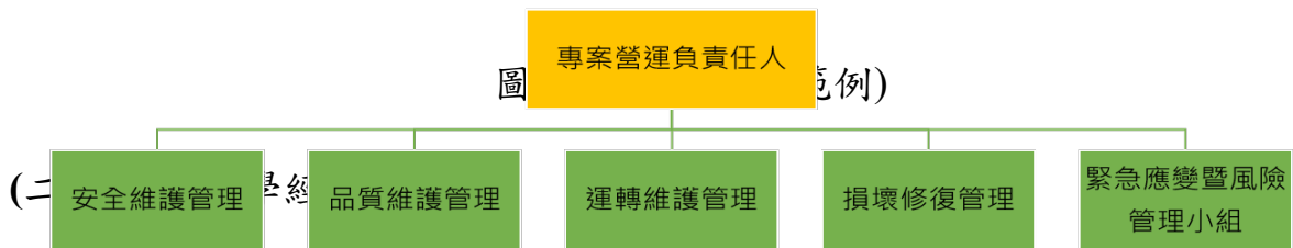
表 6 維護人員學經歷表(範例)