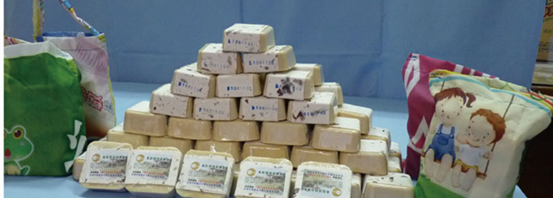
採訪對象：文賢社區

但近年有市面商品打著環保的名號，卻以偏差資訊誤導消費者，例如產品標示「對環境友善」、「綠色」、「對地球友善」、「100%純天然」等文字，卻沒有證據或第三公正單位證明，甚至可能含有害物質，影響健康及危害環境。建議民眾選購環保標章產品，才不會被這些常見的商品漂綠行銷手法所誤導。民眾也可以使用小蘇打、白醋、檸檬酸等天然無毒的清潔劑或自製肥皂，就可以將環境打掃乾淨。本期特別採訪高雄西林園區文賢社區發展協會，教大家自製友善環境且去汙力強的環保家事皂，無毒家園從日常生活建立。