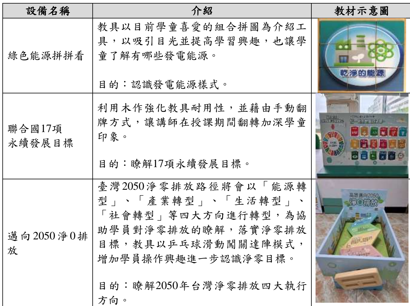
表2、113年環境教育巡迴車課程分類一覽表