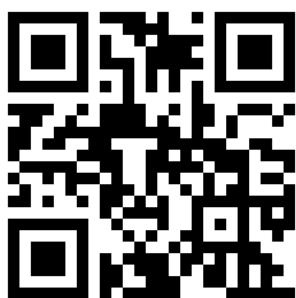
四維長青學苑 臉書粉絲團 QR 碼