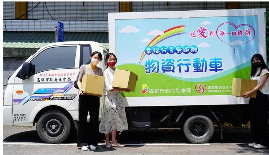
實物銀行「物資行動車」前進偏區， 送愛到每一個角落