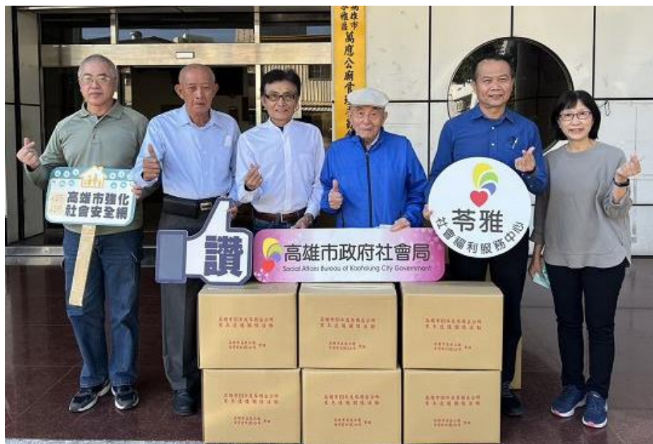
社福場館結合民間組織提供物資， 公私協力合作無間