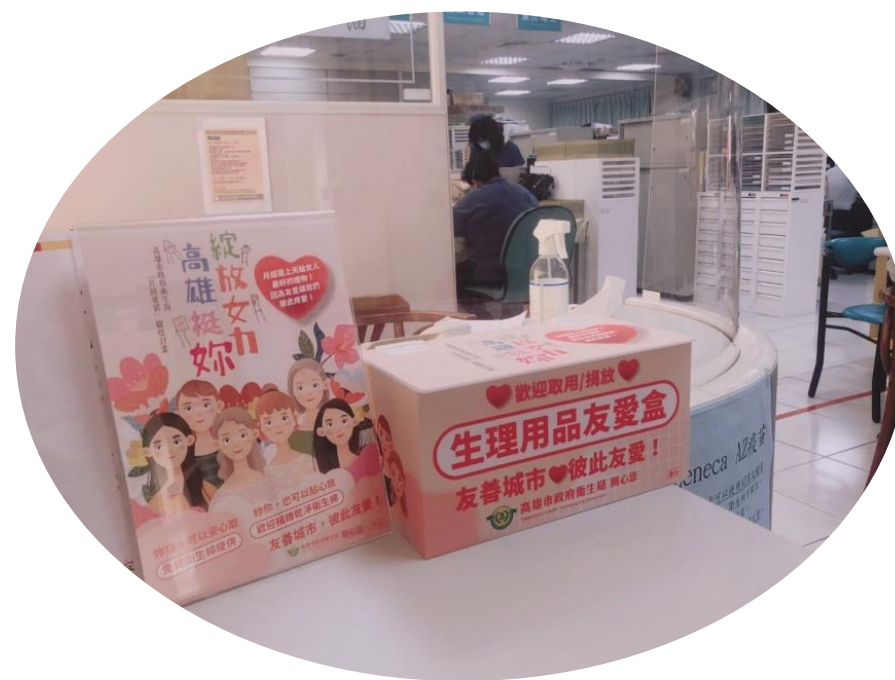
三民區第二衛生所