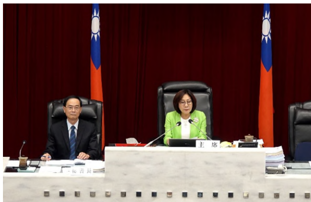
2023年6月高雄市議會成立性平委員會，中為康裕成議長