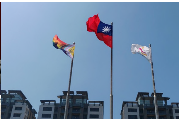
2023年5月17日國際不再恐同日 高雄市政府升多元彩虹旗 愛河點亮彩虹燈