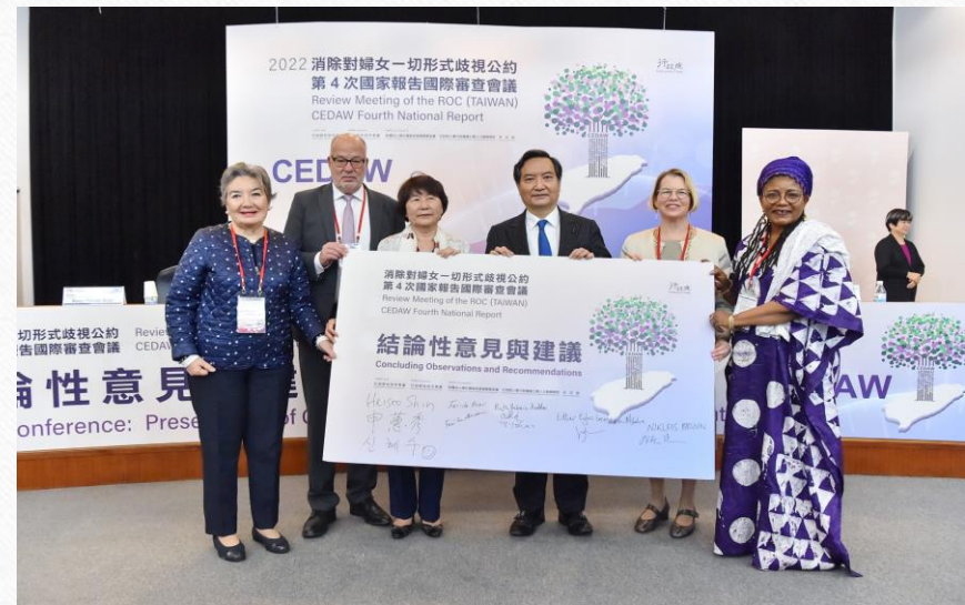
2022年臺灣CEDAW第4次結論性意見發表，五位國際人權專家及羅秉成政委（右三）。