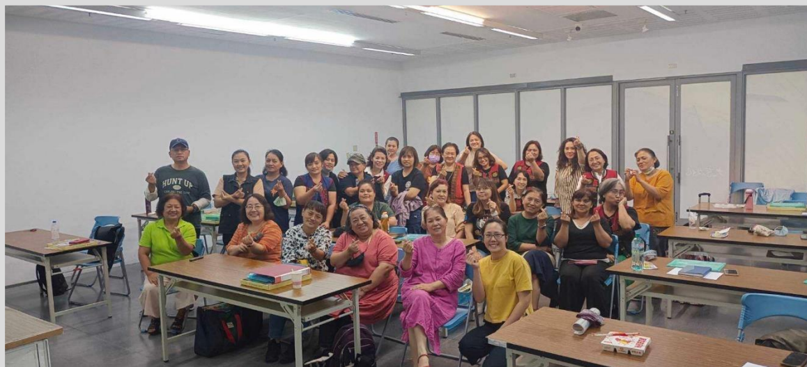
大東藝術中心場次

規劃3場次族語保母講習，參與保母包含偏鄉及都會區，具職業與城鄉資源分配平等意義。透過專題演講方式，說明從性別觀點看見家務分工困境、保母多為生理女性的傳統慣習，以及從保母現場經驗分享來增能學習。