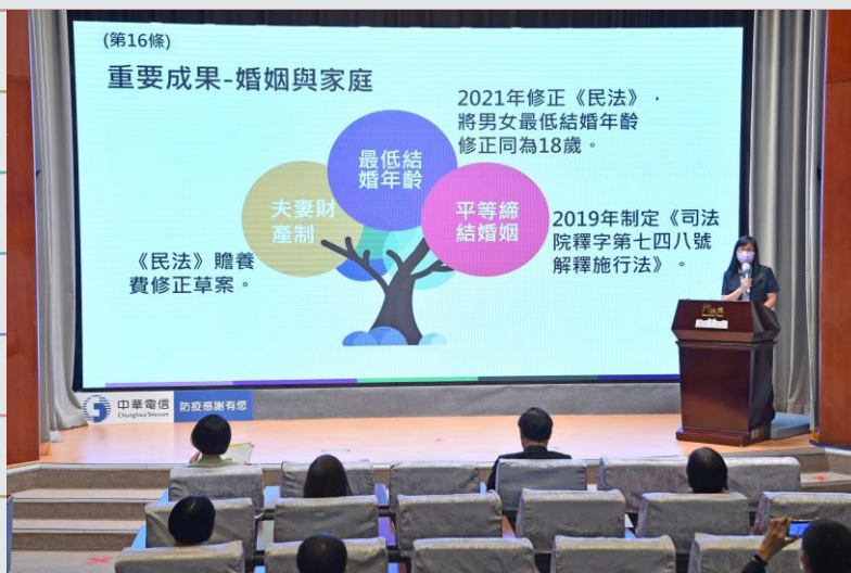
行政院性平處吳秀貞處長於2022年「CEDAW第4次國家報告發表記者會」