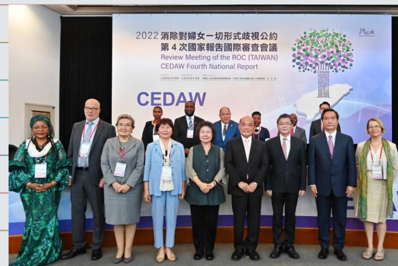
2022年臺灣CEDAW第4次國家報告前排中為國家人權委員會陳菊主委