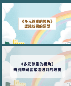
多元尊重的視角 教學影片