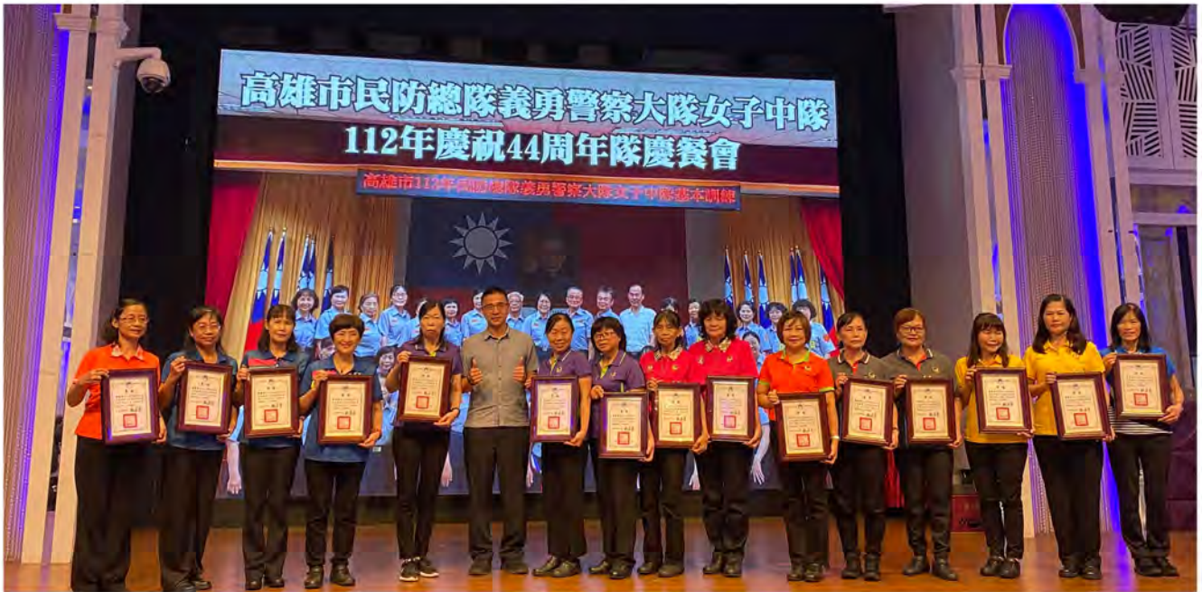
112年慶祝義警女子中隊44周年隊慶餐會頒發服務滿40、30、20年資深民防人員，感謝女義警們熱心服務，平日的付出，有你們真好！

在高雄市的早晨，每天上學都有最親切的女義警指揮交通，這個團隊展現青春、活潑、熱情的面貌，感謝這支女義警無私的投入，守護著學童的安全，成軍至今44年兢兢業業的精神相當難得，護童任務不落人後，熱心公益的表現，令人欽佩。