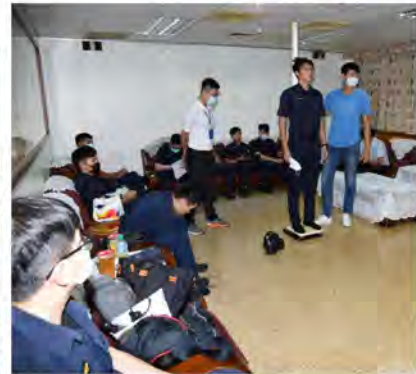
騎警隊隊員的挑選也有一定的資格條件的 喔，訓練過程一點都不馬虎。

陳市長其邁在民國94年擔任高雄市代理市長期間，有鑑於市民與旅人在高雄市最常接觸到的政府部門就是警察局，舉凡諮詢、交通、救難協助等問題，民眾第一個想到的對象也是24小時不間斷，穿梭在大街小巷值勤的警察人員。然而執法取締時的嚴肅是民眾對警察產生的第一印象，會讓民眾保持一定距離且不太想親近，在這樣的時空背景下，陳市長指示警察局成立極具親和力又可充分代表高雄市熱情的「觀光騎警隊」，讓警察與市民朋友及海內外旅人的距離更為親近，也將警察服務範圍擴及到機動車輛難以進入的海灘(如旗津海水浴場)、公園(中央公園、美術館等)、各大觀光景點(蓮池潭)等處所。今天，高雄市政府警察局觀光騎警隊成立已經滿18年了。