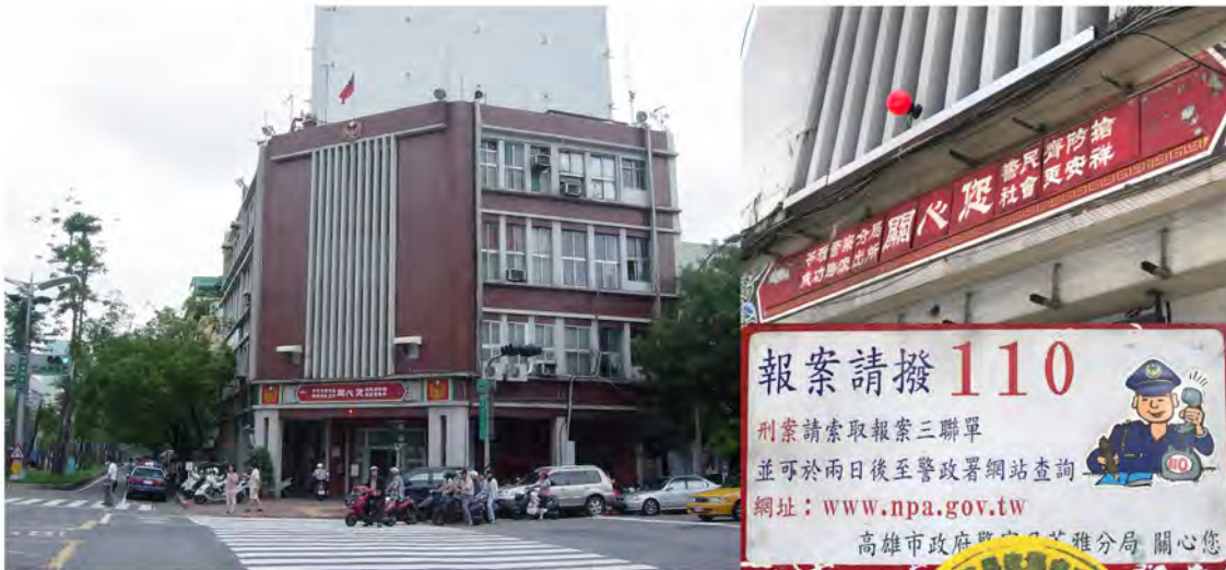
成功路派出所該建物的前身為第五分局喔，這張照片是早期的外觀。