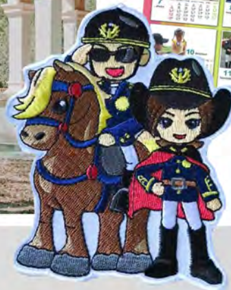
騎警隊犯罪預防宣導品深受民眾的喜歡。