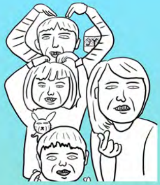
與家人一起出遊的照片，原本開開心的表情都瞬間變成厭世臉。