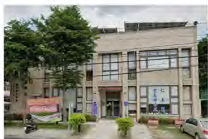
仁美派出所的新舊更替，派出所換新址，原址已改建為活動中心。

原派出所舊址是延續日治時期的田草埔警察官吏派出所，廳舍為木造建築，據資深的林姓工友稱當時木地板有時還可以聽到老鼠在底下吱吱作響。然而該地為早期地方仕紳所提供的，且土地尚未變更非機關用地，仍是20多人共同擁有的私有財產，只因其中一人因為財務的關係，遭到法院查封財產，才有了派出所遭查封的事件，當時派出所就有銀行查封的封條卻仍然持續值勤的特殊畫面。因為考量到土地問題而重新尋覓新址興建，原址後來也被烏松區公所購買，現為仁美里活動中心。隨著時間飛逝，轄區所發生的點滴大小事，仍是仁美所與在地人的回憶，警察依然堅守崗位，守護著這塊土地上的居民。