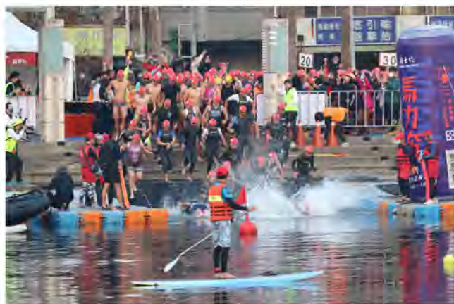
感謝各位夥伴的鼓勵與支持，讓我愛河鐵人獲得分組第一的佳績。