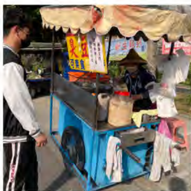
臭豆腐也是學生下課時點心的選擇之一。

每到下午時刻，總會見到一名老婆婆彎著腰推著餐車準備出攤，從活動中心一路賣到郵局，熱油中一塊塊手切的豆腐，是仁美人從小到大的好味道。點餐後，看到阿嬤熟練將豆腐放入油鍋中，炸好後，將大塊臭豆腐切成小塊再過一次油，品嚐起來皮酥內嫩，搭配自製醬油膏、泡菜，是一種晚餐前填補口腹的臺式點心。另一家開三十幾年的七里香鹹酥雞更是非吃不可，要注意的是營業時間跟平常鹹酥雞不同，約晚上七點左右就賣完打烊了，可見吸引一群忠實的饕客；推薦必點的是魷魚跟甜不辣，那口感超酥脆，會越吃越順口喔！