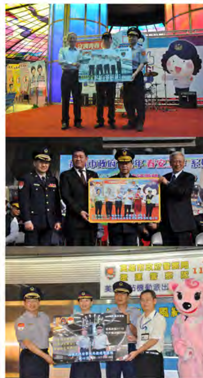
捷運警察隊曾發行的紀念一卡通，是增加警民間良性互動的最佳宣導品。