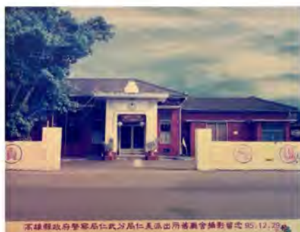
高雄縣政府警察局仁武分局仁美派出所舊廳舍攝影留念 95.12.29