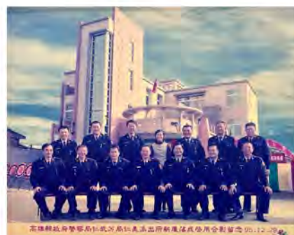
高雄縣政府警察局仁武分局仁美派出所新廳舍啟用合影留念 99.12.29