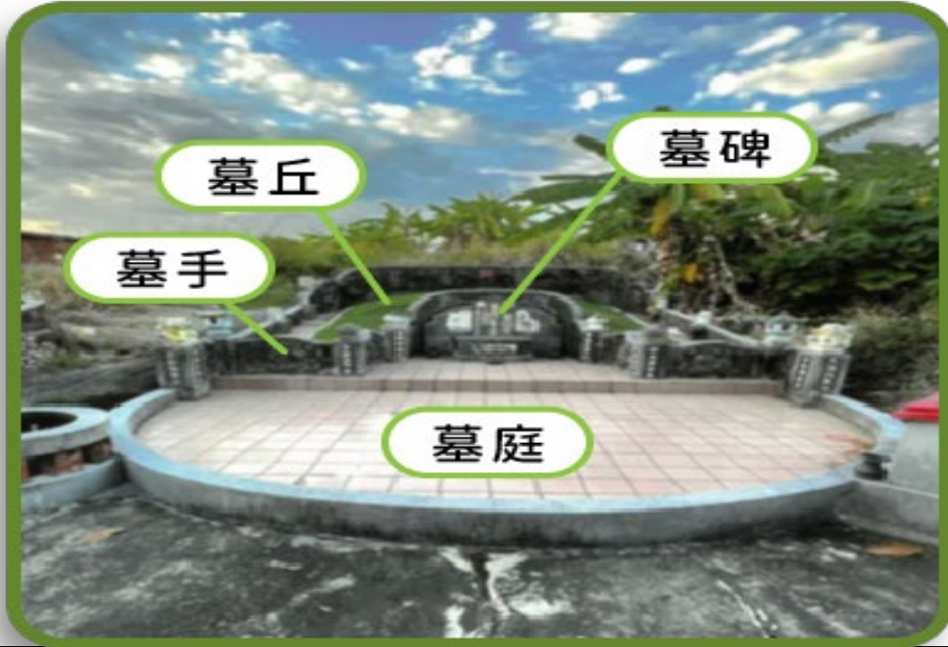
起掘前之彩色遠照(全墓)