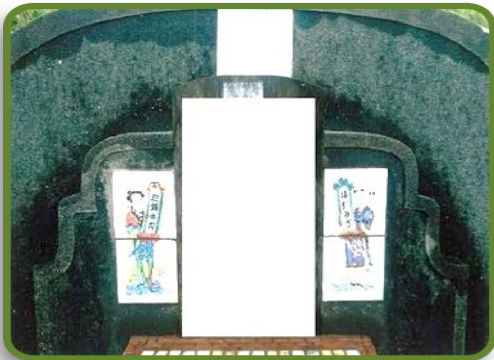
起掘前之彩色近照(墓碑)