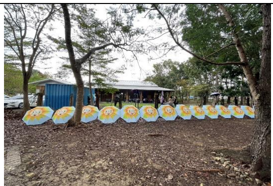
(2) 活動後之清潔維護。