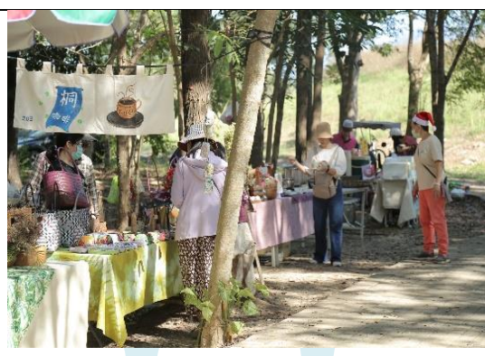
2. 農特產品專區:行銷本區在地農特產品，增進農民收入。