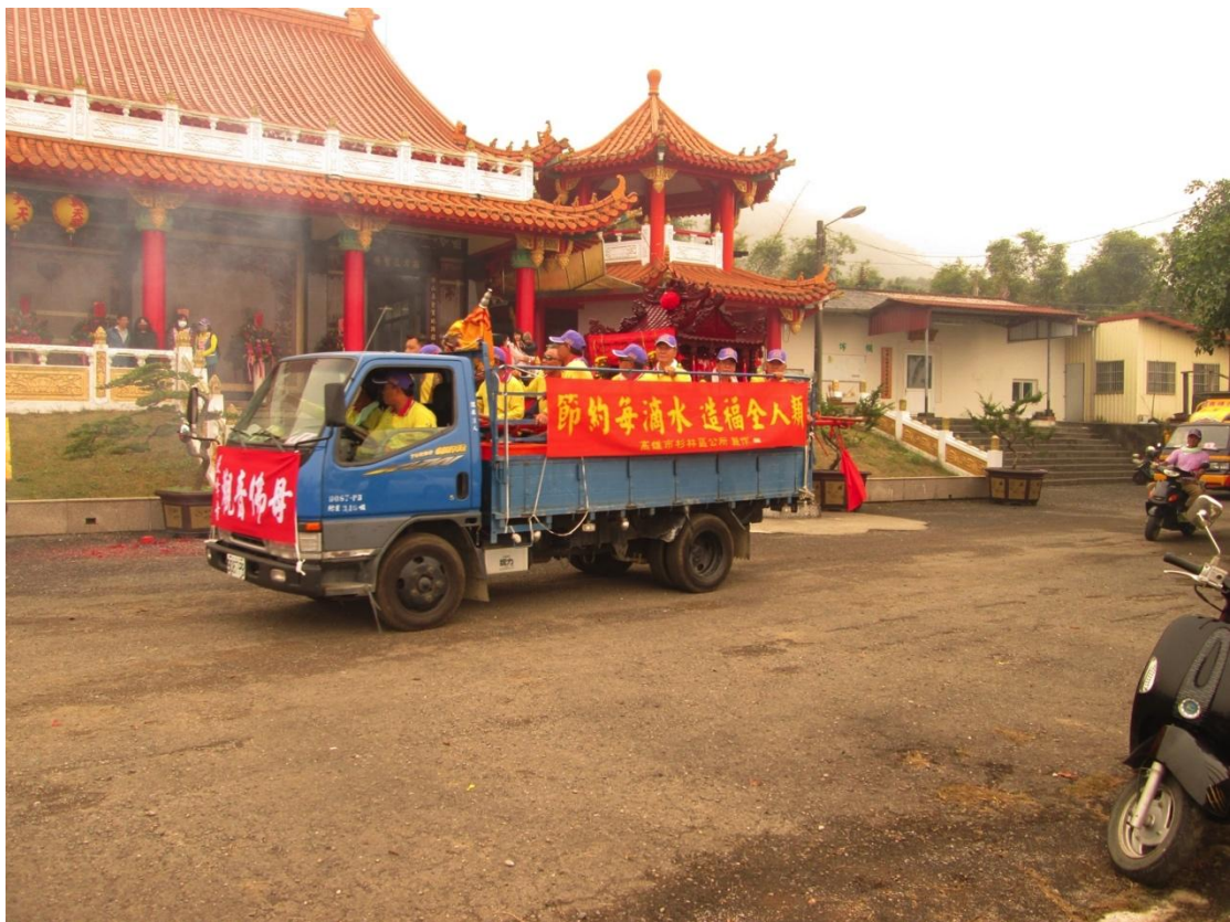
利用遶境車輛懸掛兩側布條達到宣導效果（月美里）