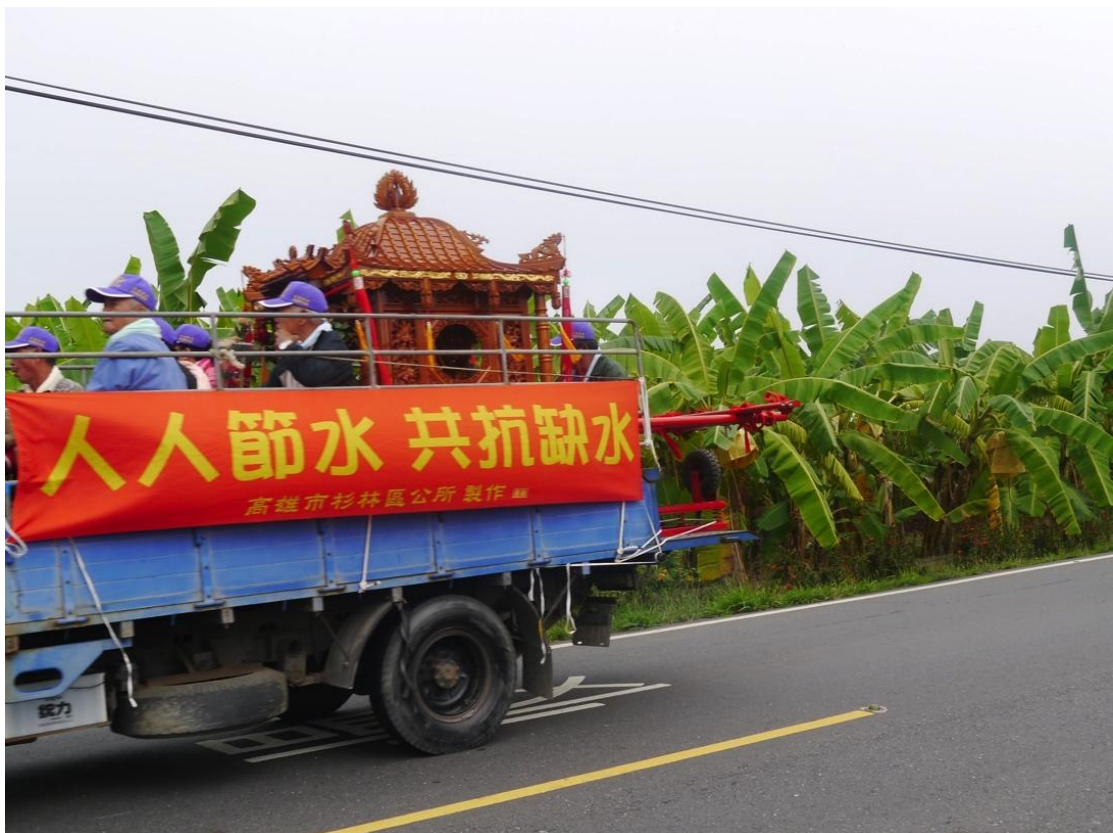
利用遶境車輛懸掛兩側布條達到宣導效果（木梓里）