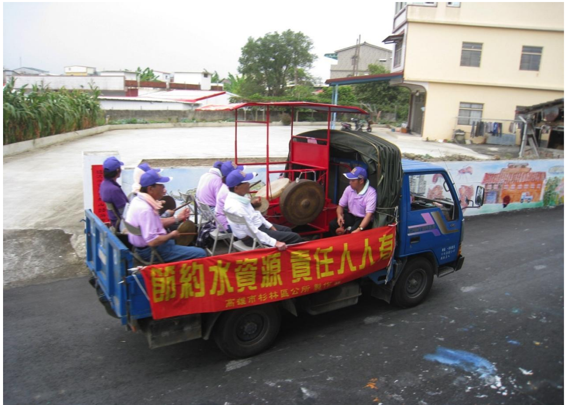
利用遶境車輛懸掛兩側布條達到宣導效果（上平里）