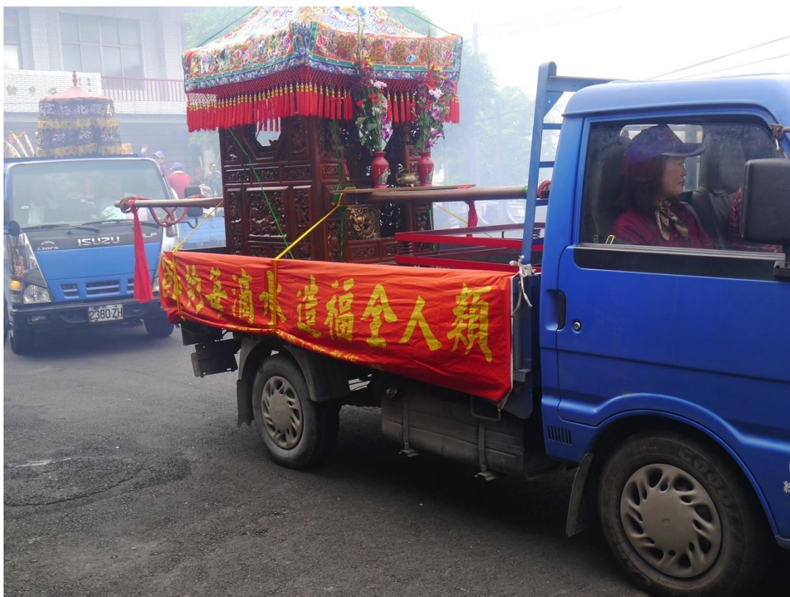
利用遶境車輛懸掛兩側布條達到宣導效果（集來里）