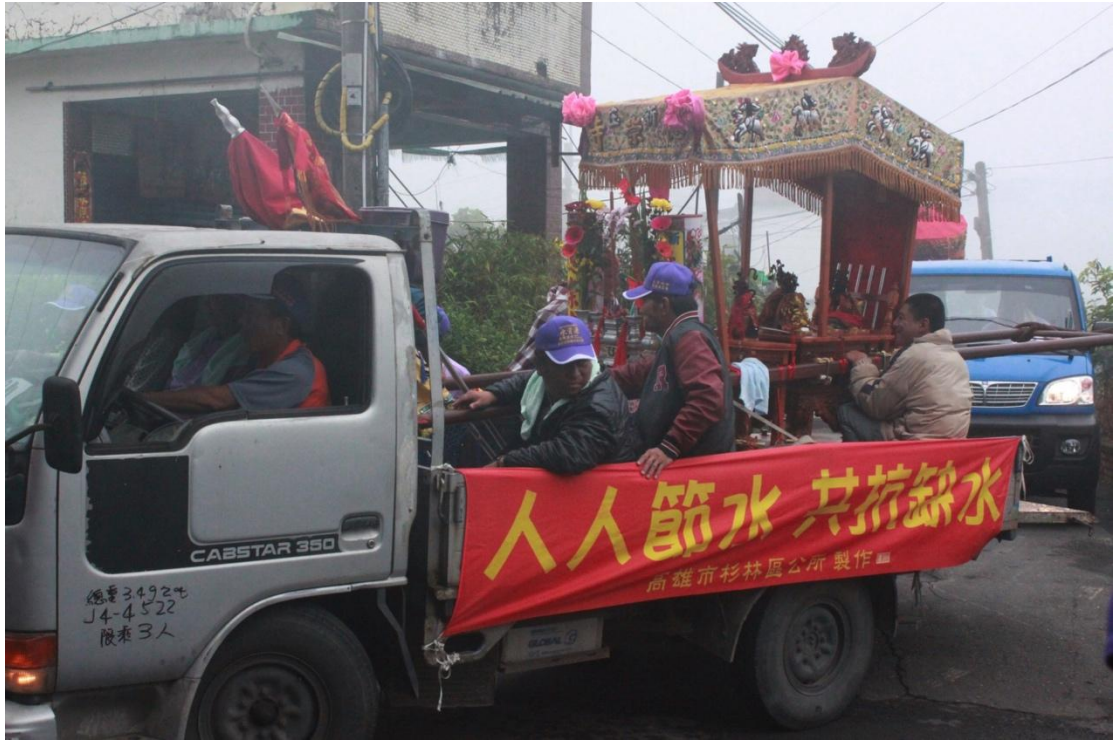
利用遶境車輛懸掛兩側布條達到宣導效果（杉林里）