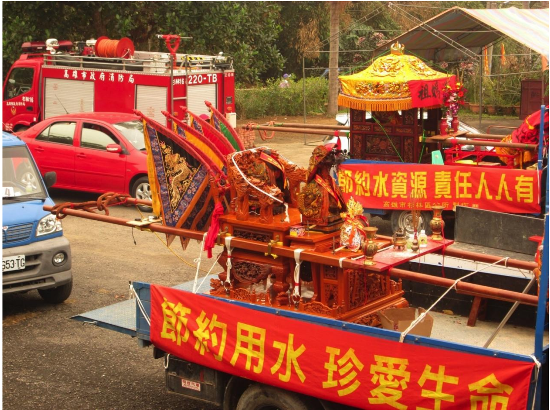
利用遶境車輛懸掛兩側布條達到宣導效果（月眉里）