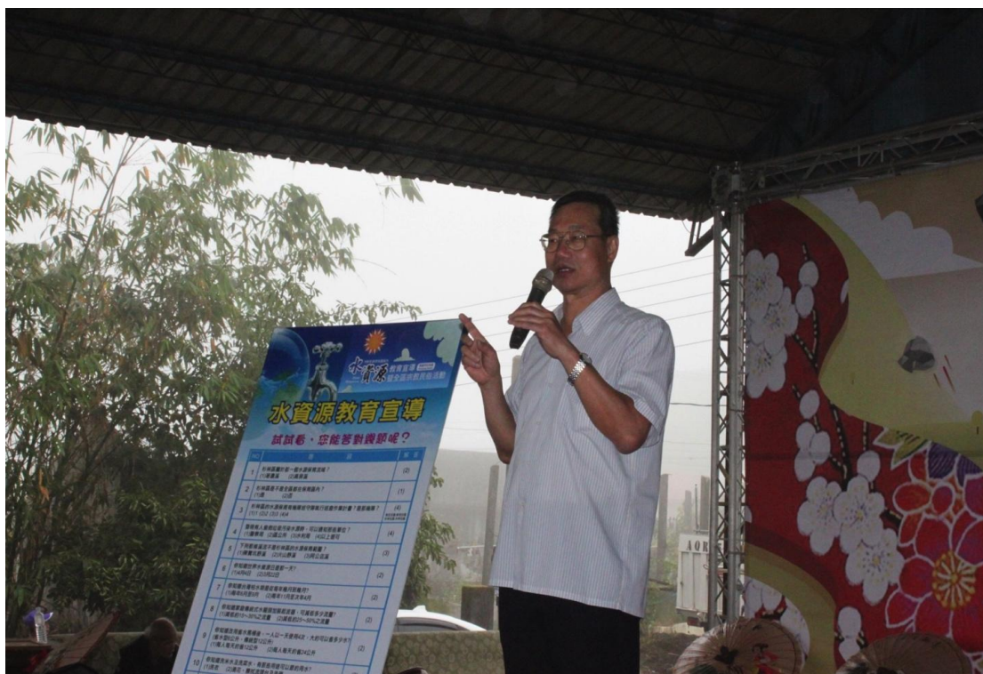
利用民眾聚集積極宣導水資源教育（武當廟）