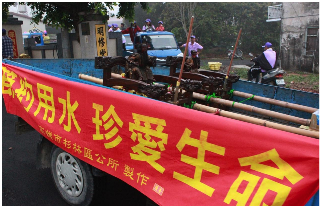
利用遶境車輛懸掛兩側布條達到宣導效果（新庄里）