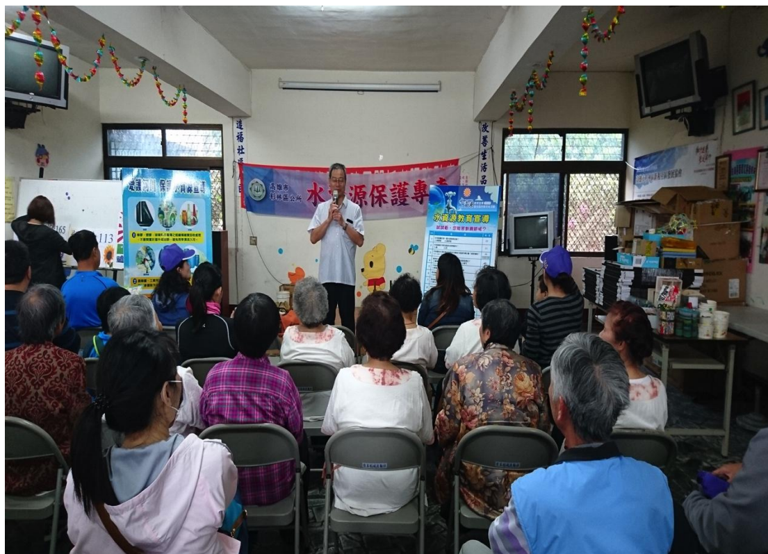
利用民眾聚集積極宣導水資源教育（新庄里新和活動中心教室）