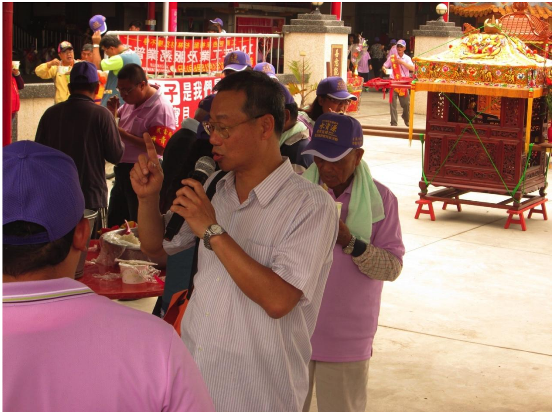
利用民眾聚集積極宣導水資源教育（樂善堂）