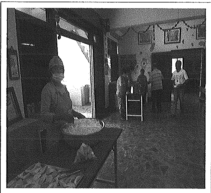
照片說明 午餐情形