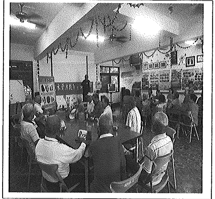
照片說明 宣導水資源之重要性