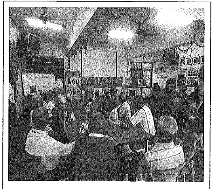
照片說明 節約用水方式