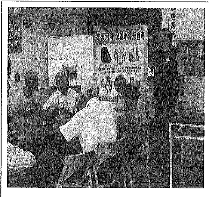
照片說明 保護河川，不亂丟垃圾