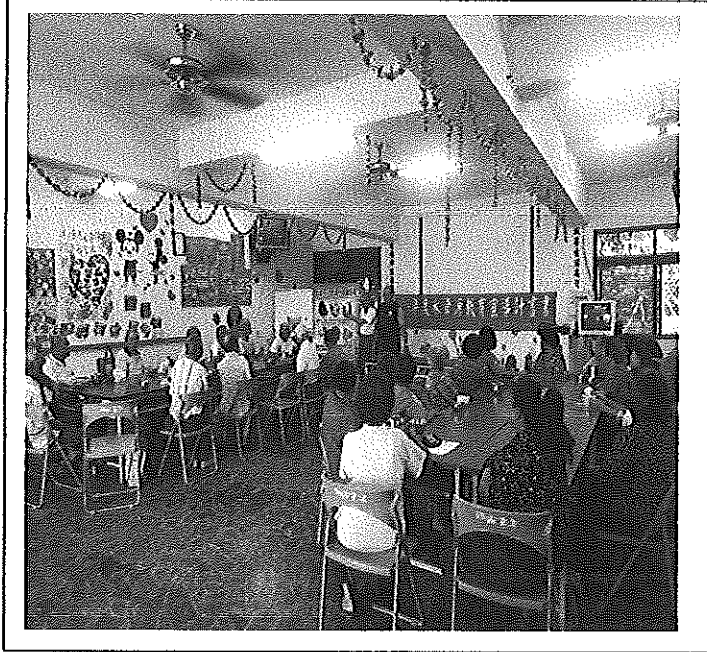
照片說明 落實愛護水資源