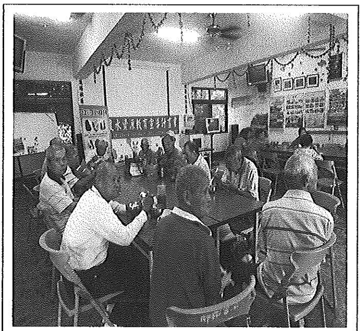
照片說明 午餐情形