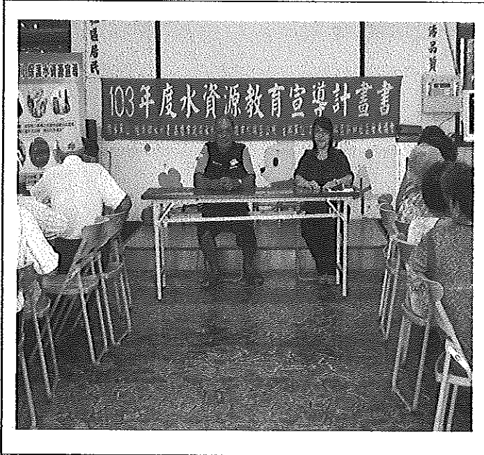
照片說明 水資源教育宣導