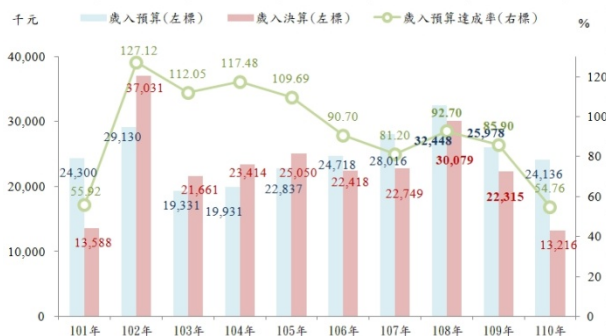
圖 1 101~110 年高雄市岡山區公所歲入預決算概況

110 年本所歲入預算計 2,413 萬 6 千元，歲入決算計 1,321 萬 6 千元，較 109 年分別減少 184 萬 2 千元(-7.09%) 及 909 萬 9 千元(-40.78%)，較 101 年分別減少 16 萬 4 千元(-0.67%) 及 37 萬 2 千元(-2.74%)。110 年歲入預算達成率為 54.76%，決算較預算短收 1,092 萬元，主要係捐獻及贈與收入短收所致。(詳圖 1、表 1)