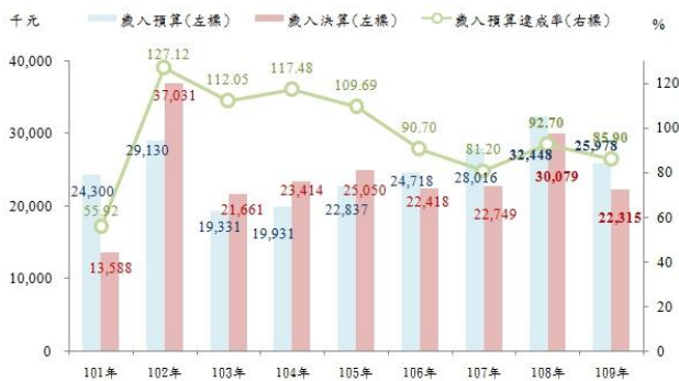
表1 109年高雄市岡山區公所 歲入預決算概況—按來源別分