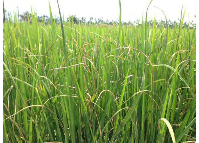
受水稻白葉枯病危害導致葉片乾枯