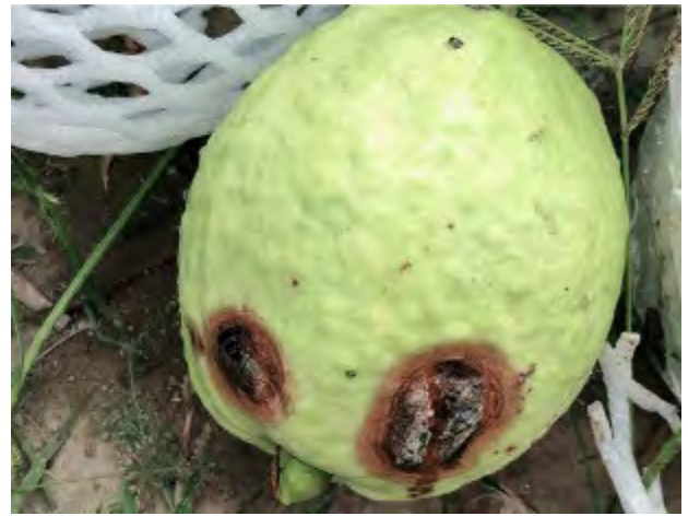
番石榴果實病害，嚴重影響商品價值