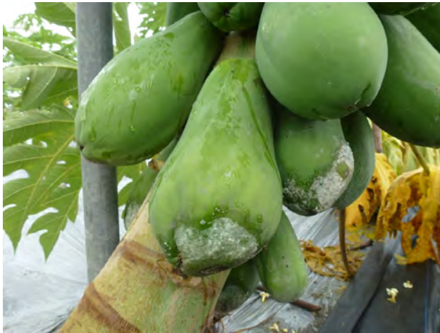
木瓜果實接近地面處易受疫病危害