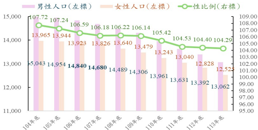
圖 1 103-113 年底高雄市旗津區人口性別概況

113 年底本區人口總計 2 萬 5,587 人，其中男性為 1 萬 3,062 人(占 51.05%)，女性為 1 萬 2,525 人(占 48.95%)，男性人口略多於女性，男性較 112 年底減少 330 人(-2.46%)及女減少 303 人(-2.36%)。113 年底本區人口性比例為 104.29，相當於 100 名女性對應 104.29 名男性，自 103 年底起性比例呈逐年降低趨勢，由 104 年之 107.72 降至 113 年之 104.29，男性人口數一直多於女性，113 年底性比例創歷年新低點。(詳圖 1)