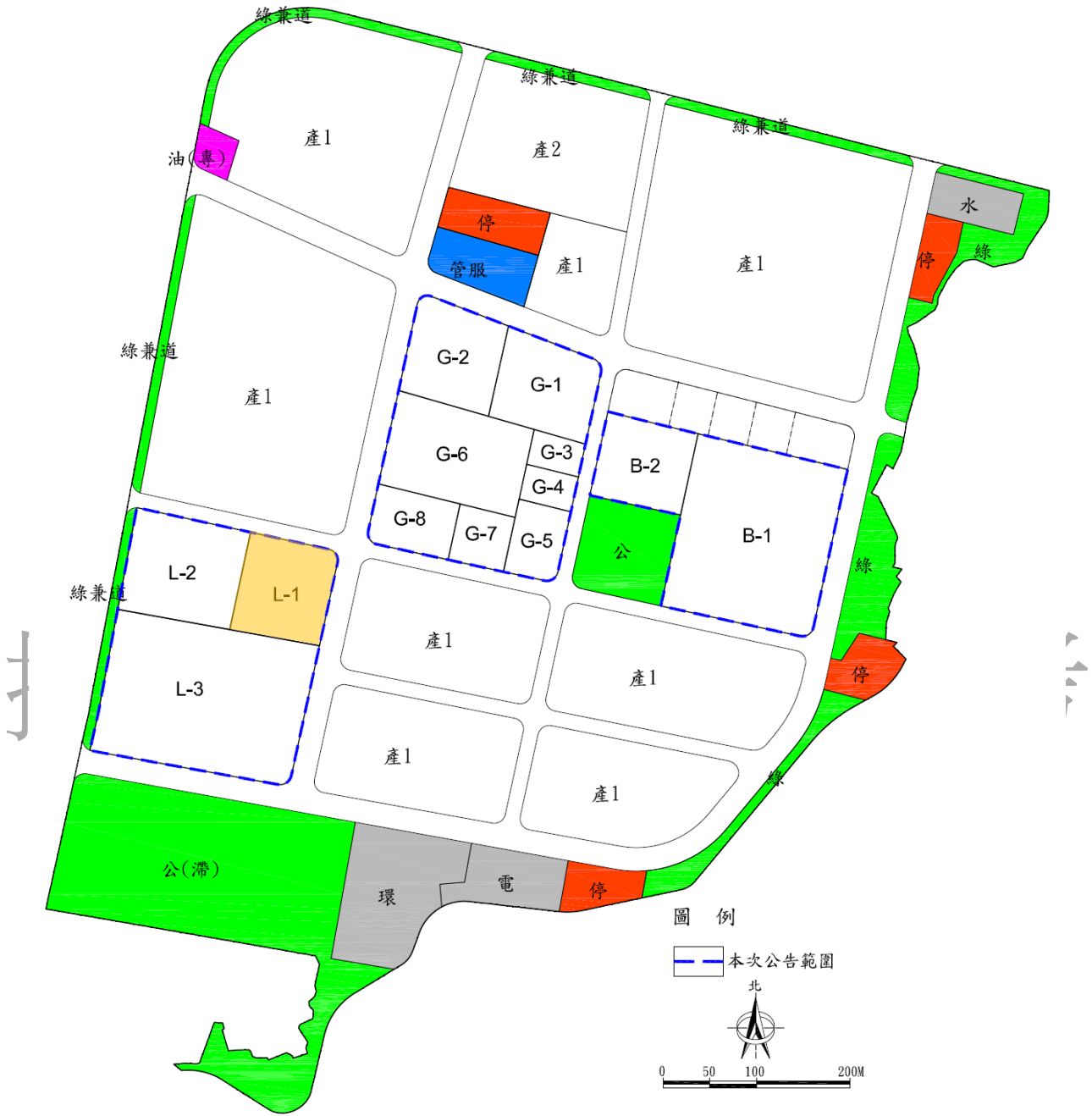
產業用地(一)土地出租位置圖