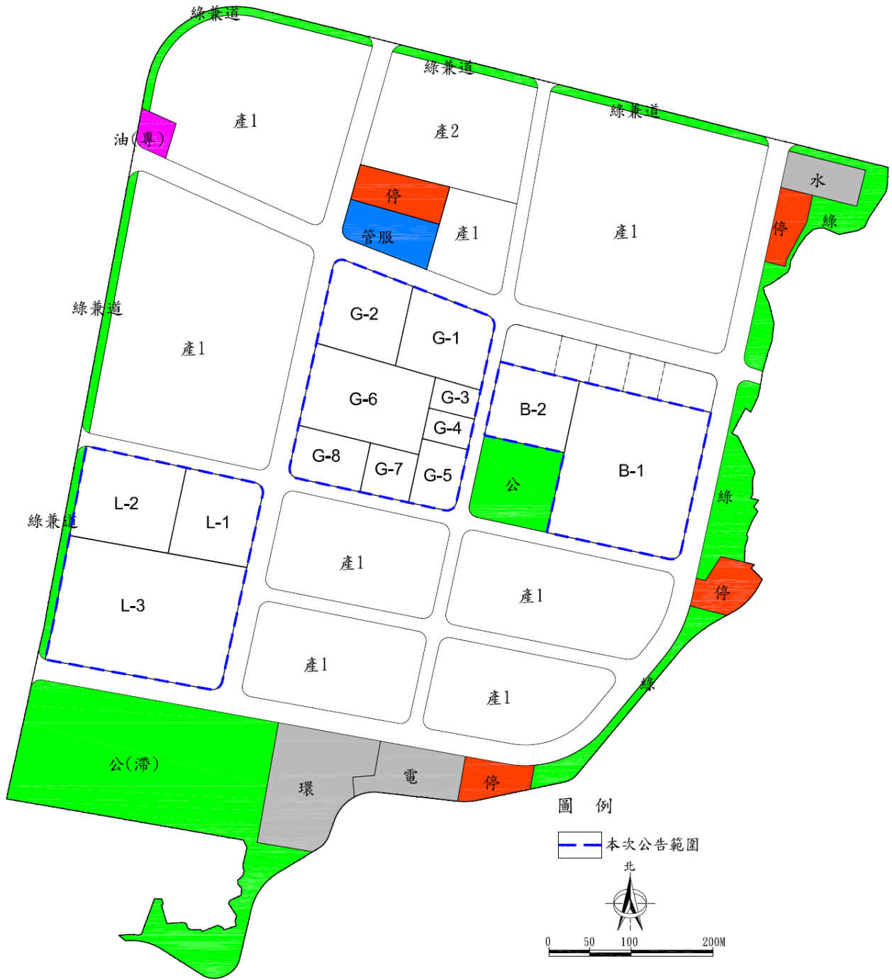
仁武產業園區產業用地(一)土地出租坵塊圖