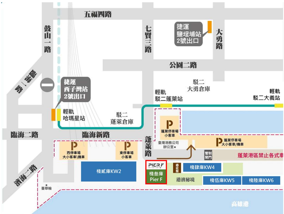
圖一、棧叁庫場域位置圖