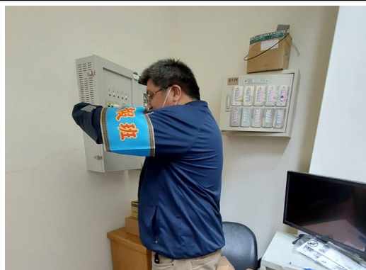
滅火班：初期滅火(滅火器、室內消防栓)