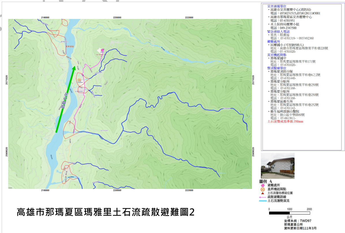
高雄市那瑪夏區瑪雅里土石流疏散避難圖2