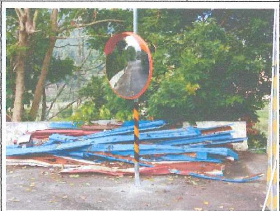
南沙魯里民族教會下方