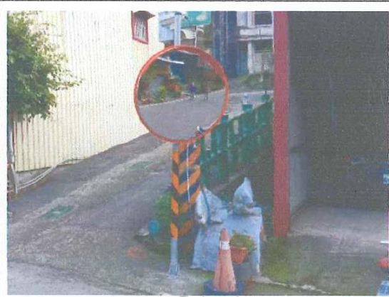
南沙魯里秀蘭商店