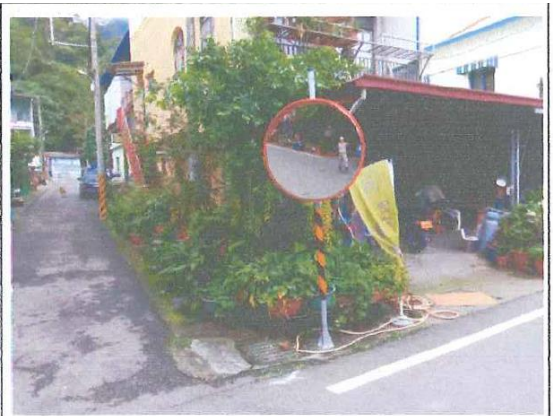
南沙魯里台 29 線