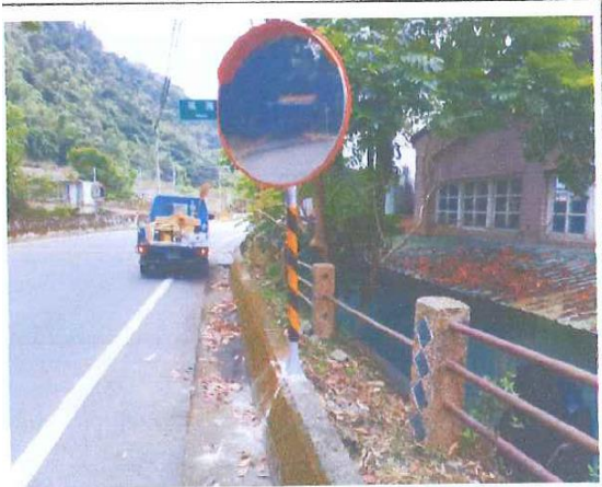
那瑪夏國中上方停車場