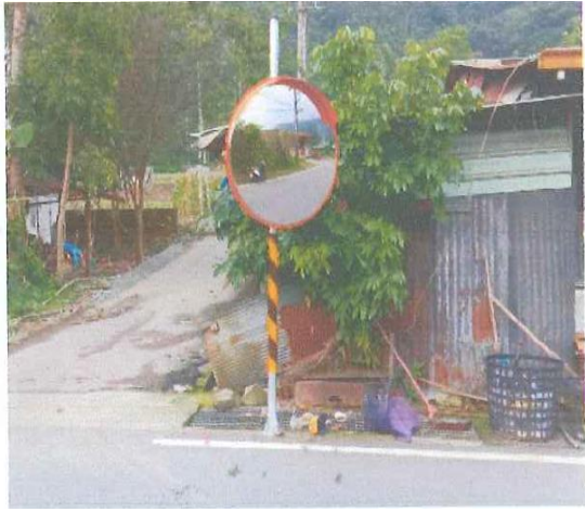
台 29 往 SAOO 路口