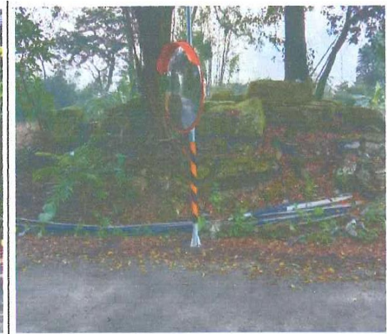
瑪雅還鄉道路(往舊民權國小遺址)