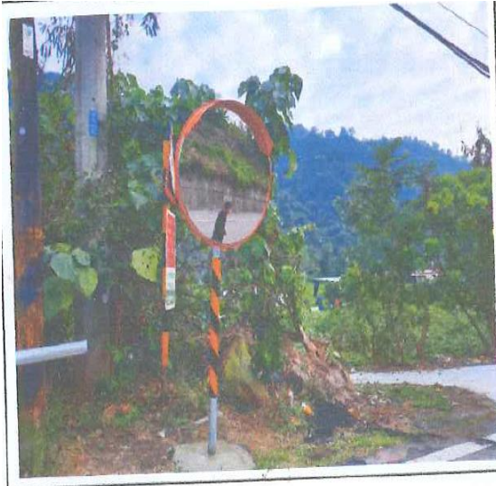
民生橋往瑪雅台 29 線 3K+250