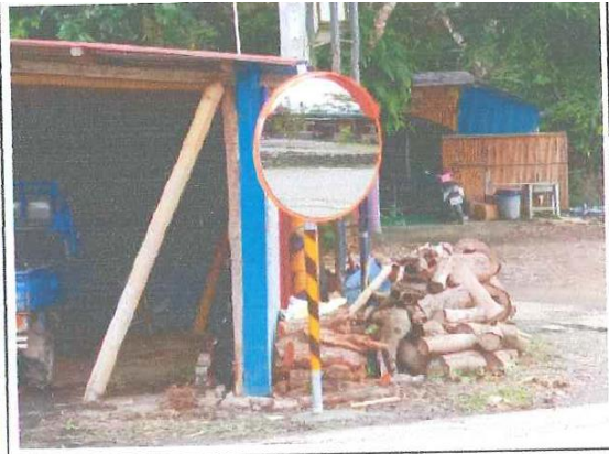
瑪雅社區(芒果市集)