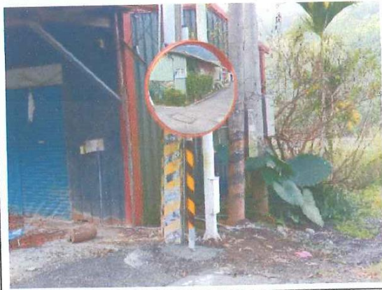
瑪雅里菲力安民宿下方