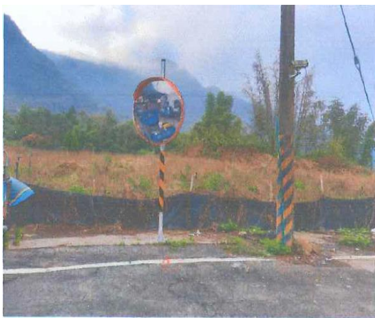
大光巷真耶穌教會下方