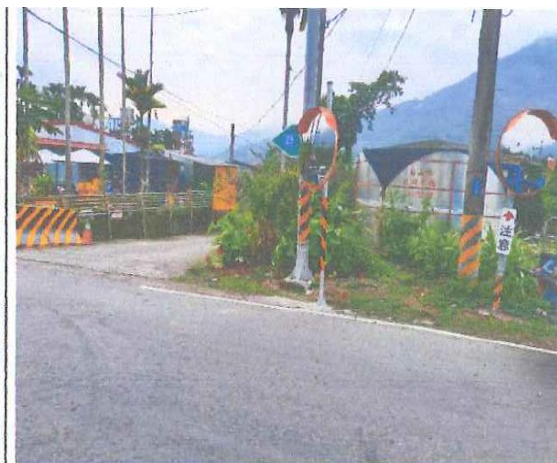
世文商店 T 字路口