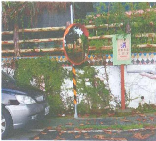
達卡努瓦派出所上方