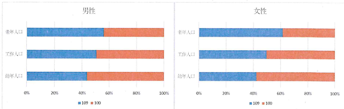
圖 2 左營區人口年齡結構

自 100 年底以來兩性幼年人口及工作年齡人口比率，不論男女皆有明顯縮小現象，而老年人口比率則男女皆明顯增加，且女性增幅明顯大過男性。(詳圖 2)