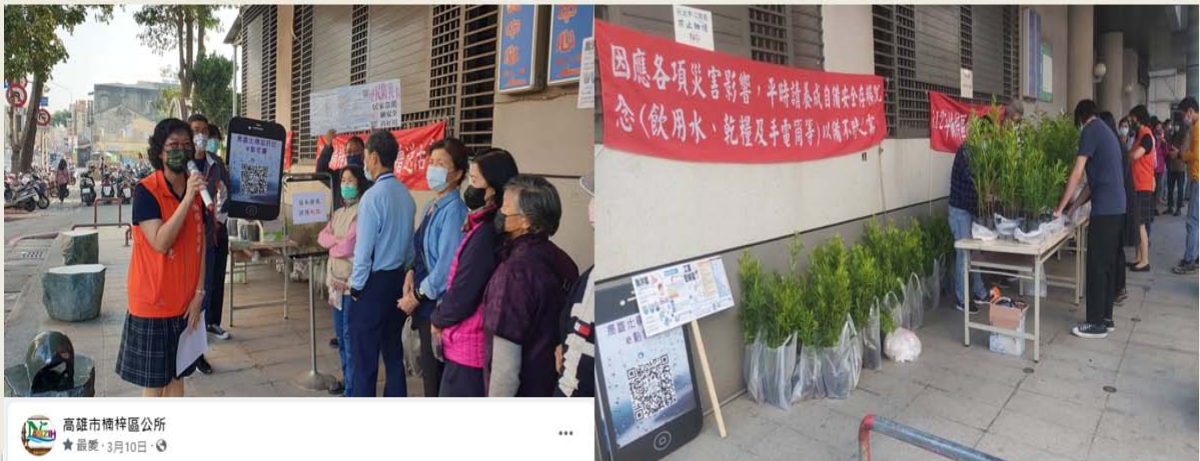
高雄市楠梓區公所 ★最愛·3月10日·📍

112.3.10宣導，本所於3月10日(星期五)上午8時30分辦理「112年植樹節樹苗發放活動」，民眾反應熱烈，上午9時30分已全數發送完畢(羅漢松300株、楓香200株及光臘樹100株)；發送期間並宣導民眾多支持「高雄市水情e點靈」Line APP、「里民防災卡」及「為免災害影響呼籲民眾平時儲備安全存糧」。/300人