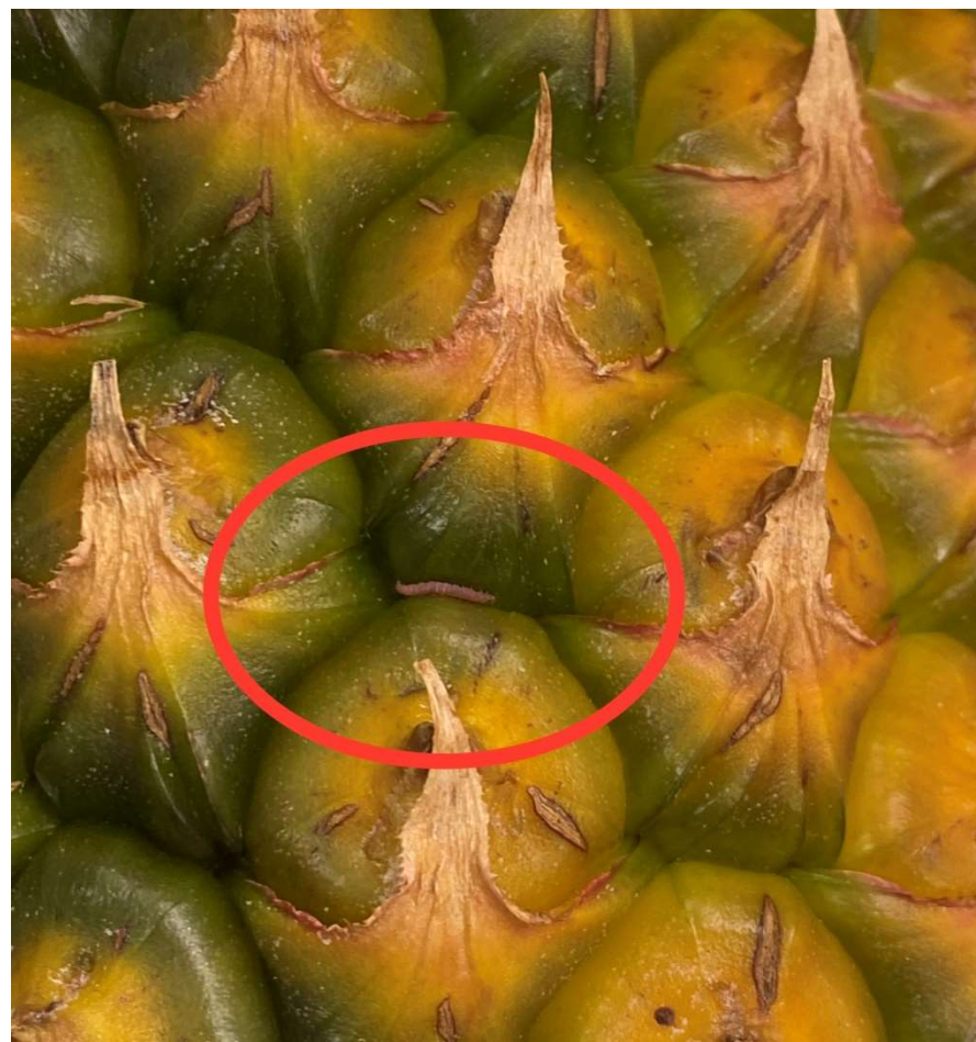
果目間隙爬行的熟齡幼蟲