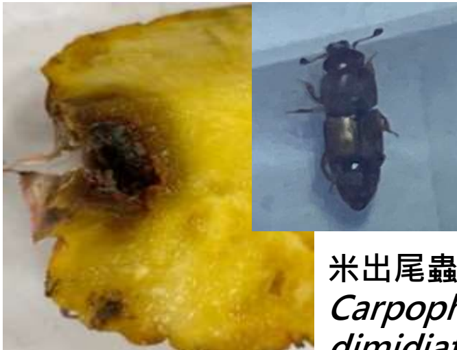
米出尾蟲 Carpophilus dimidiatus