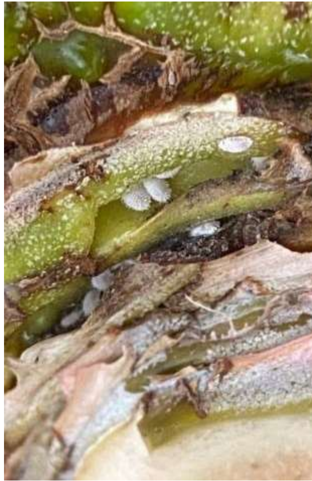
✓鳳梨灰粉介殼蟲 Dysmicoccus neobrevipes