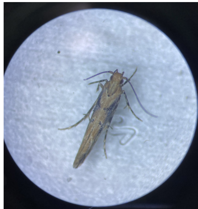
✓ Anatrachyntis rileyi 玉米簇尖蛾