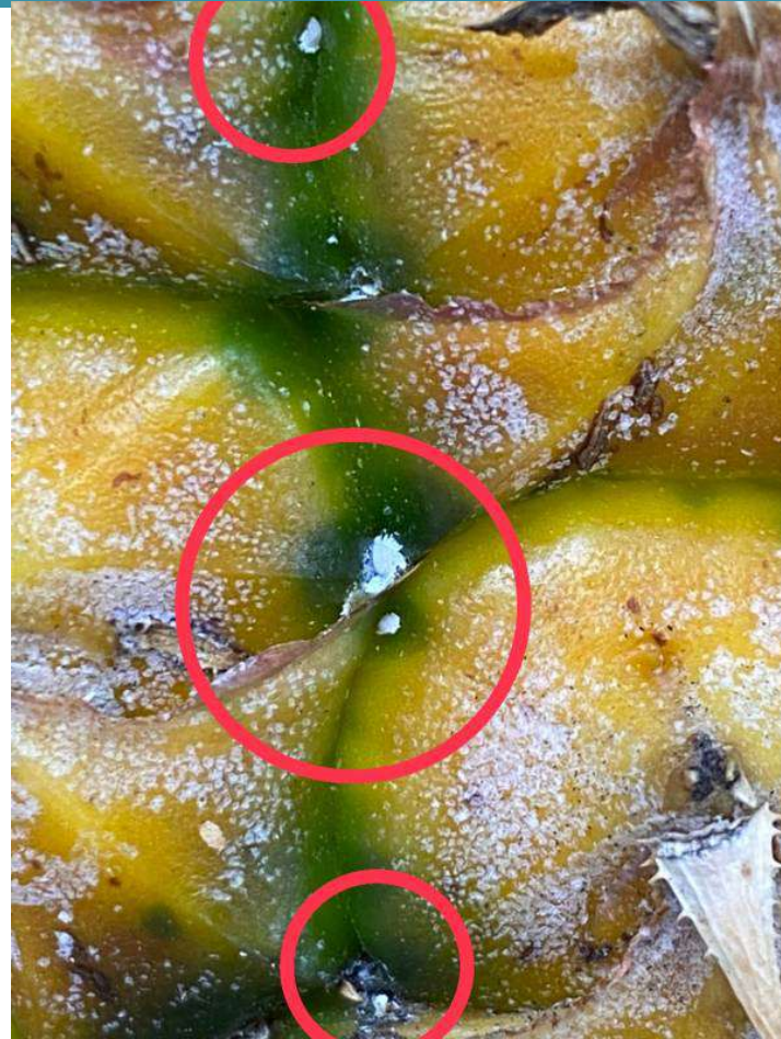
介殼蟲發生嚴重引起煤煙病(左)；果實旁側介殼蟲易忽略未清理(右)