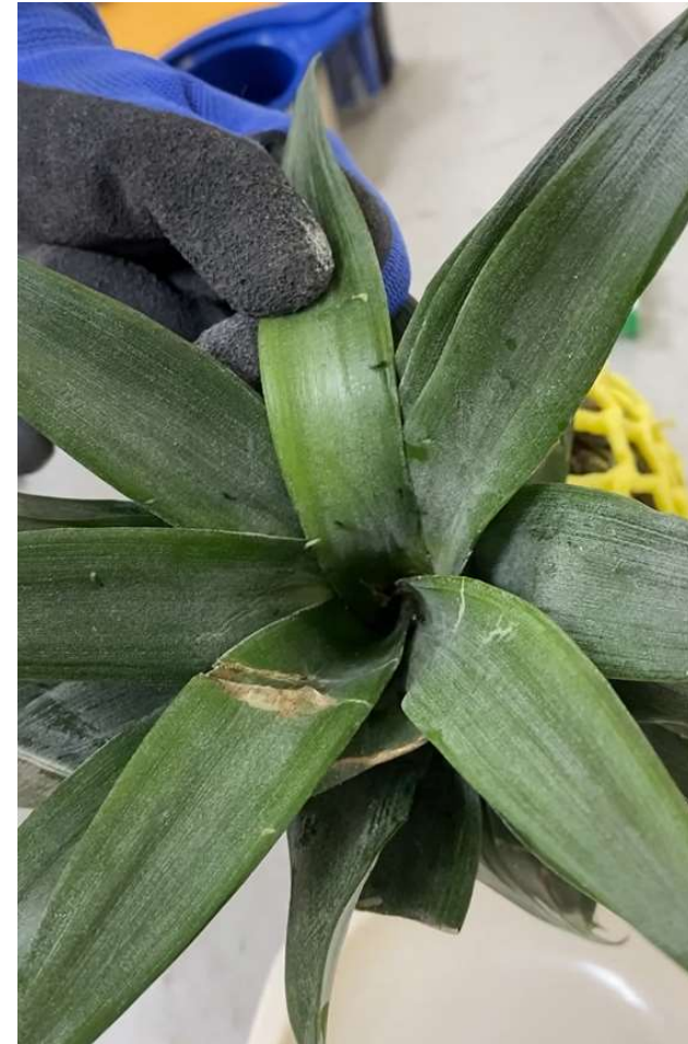
長角黃山蟻 Paratrechina longicornis