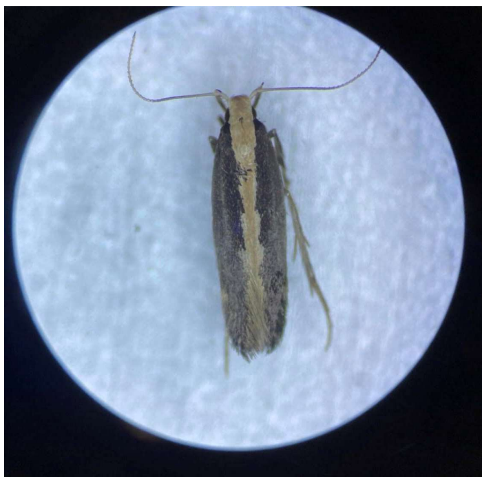
✓ Labdia sp.