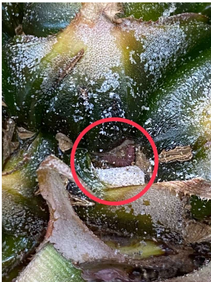
準備化蛹的老熟幼蟲，被蟲絲包圍