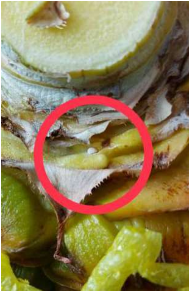
✓鳳梨嫡粉介殼蟲 Dysmicoccus brevipes