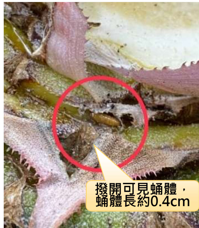
撥開可見蛹體， 蛹體長約0.4cm