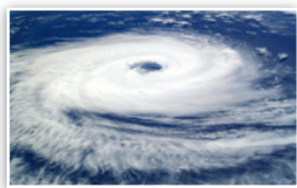
保險承保事故 颱風及洪水