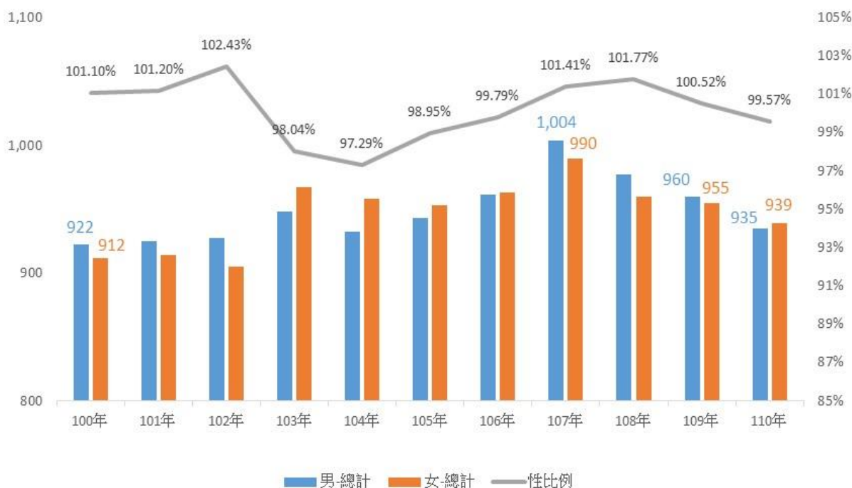
圖 1 100~110 年底茂林區人口性別概況

110 年底本區人口總計 1,874 人，其中男性為 935 人(占 49.89%)，女性為 939 人(占 50.11%)，男性人口略少於女性，分別較 109 年底減少 25 人(-2.60%)及 16 人(-1.68%)。110 年底本區人口性比例為 99.57，相當於 100 名女性對應 99.57 名男性，自 100 年起至 104 年性比例由 101.10 降低至 97.29，隨後開始上升至 108 年 101.77 高點後又開始下降，平均而言，維持在 100 左右，且 103 年底性比例低於 100，女性人口首度超過男性。(詳圖 1)