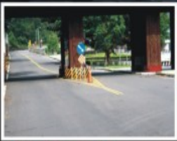
1.茂林國家風景區大門