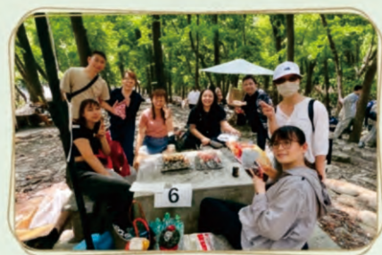
搞賞自己、開心烤肉