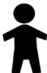
圖五 兒童馬桶或兒童小便器