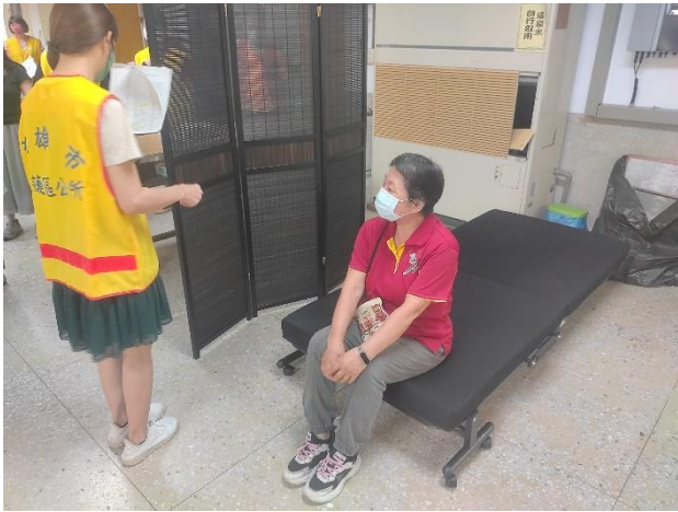
工作人員引導至醫療站並等待就醫