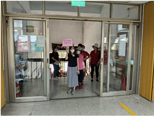
災民排隊陸續進入收容處所