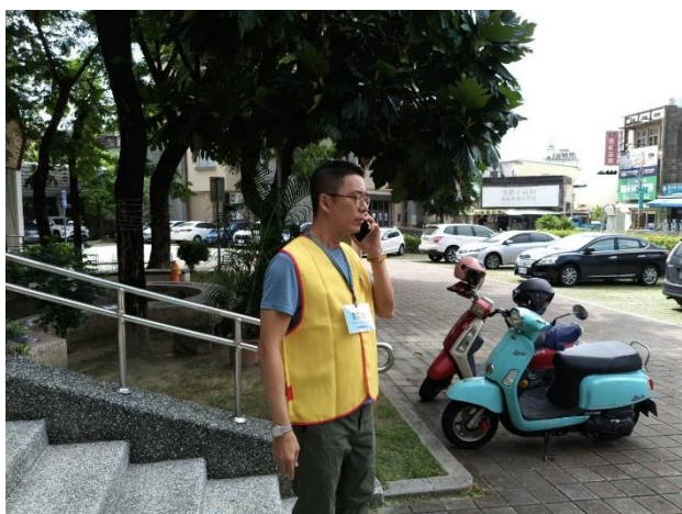
區級災害應變中心通知開設收容站