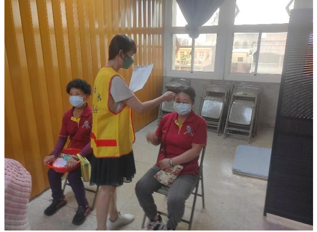
災民發生高燒情況