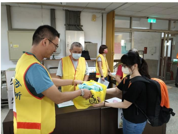
防災士提供澳洲籍旅客毛毯