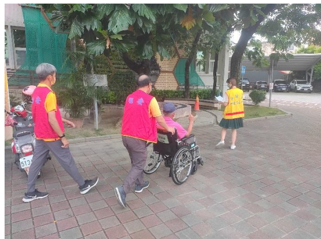
旭安日照中心人員帶領身障人士到場