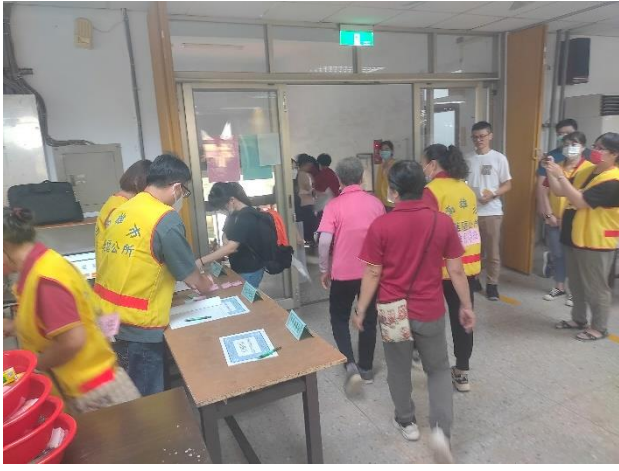
工作人員進行離所登記