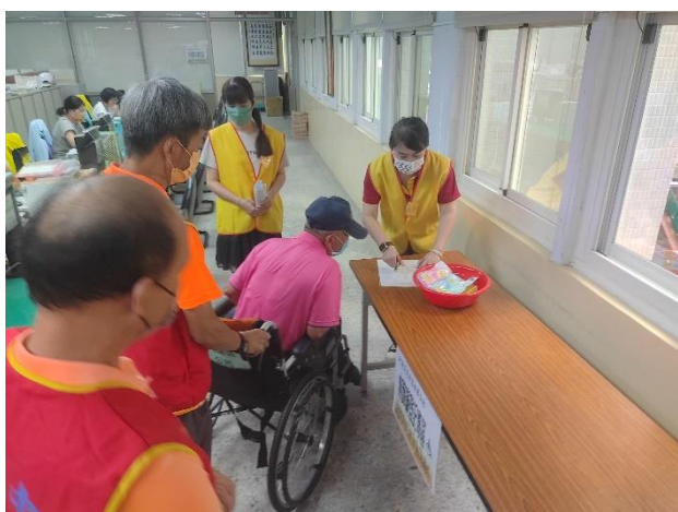
志工協助身障人士收容登記並領取物資