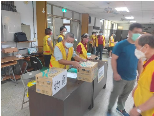
家有廚房捐贈防災物資