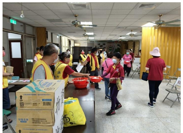
災民收容站解除，災民返還物資