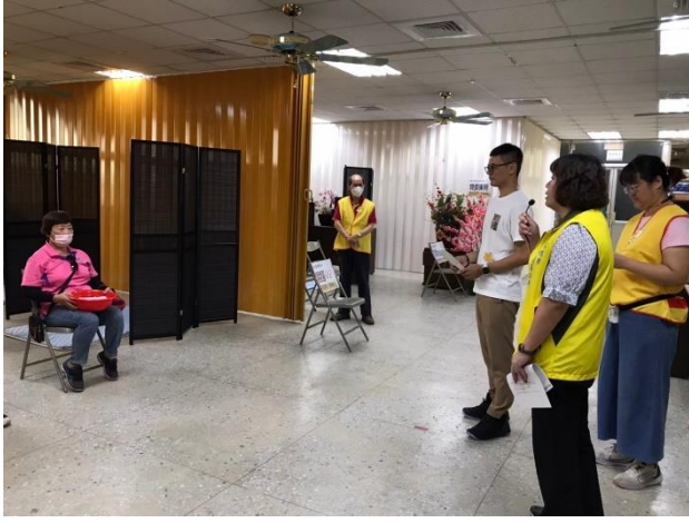
區長進行災民輔導慰問