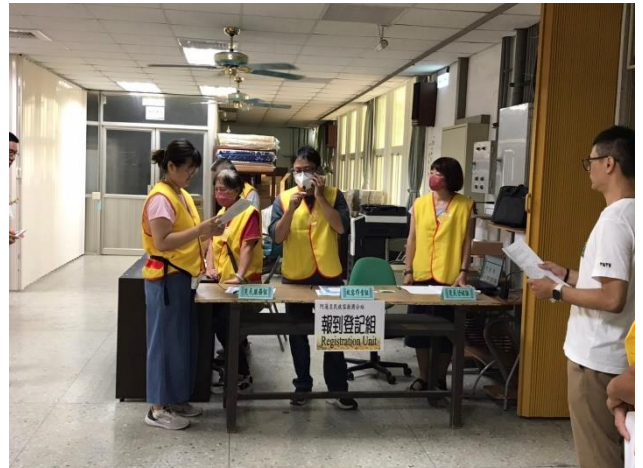
副分站長通報區級災害應變中心協助就醫