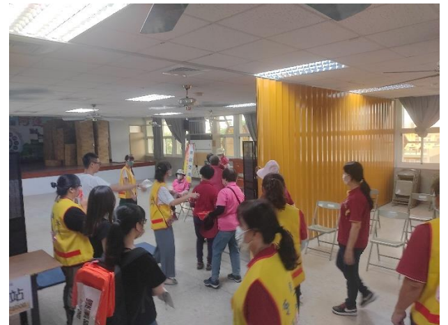
副分站長分配寢室及講述寢室規則