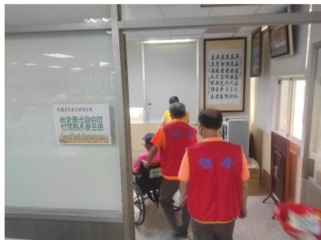
工作人員引導身障人士至特殊需求寢室休息