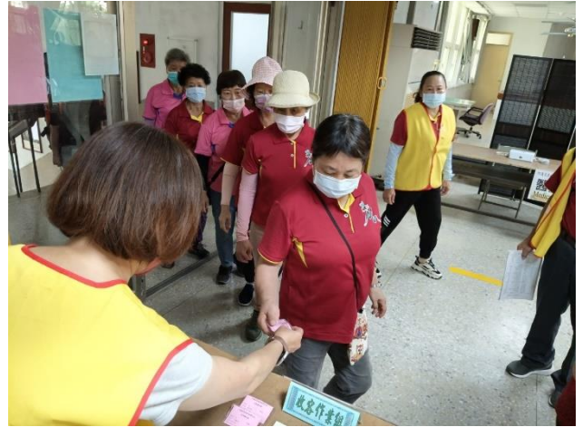
工作人員辦理收容登記