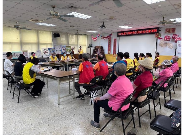
演練完成，進行檢討會