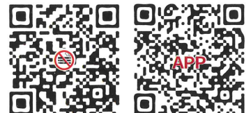
戒菸合約醫事機構 下載戒菸就贏APP