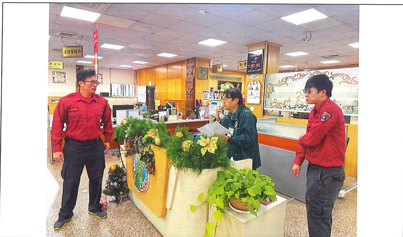
說明：確認火災、對外通報 119、對內廣播、通報情形