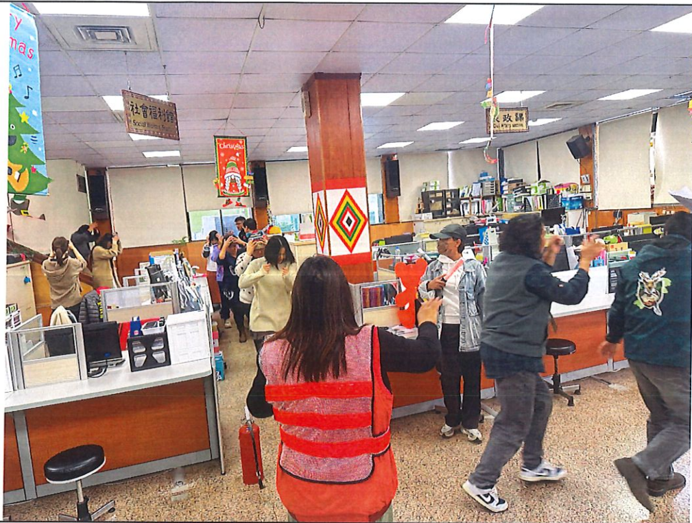
說明：引導避難逃生情形