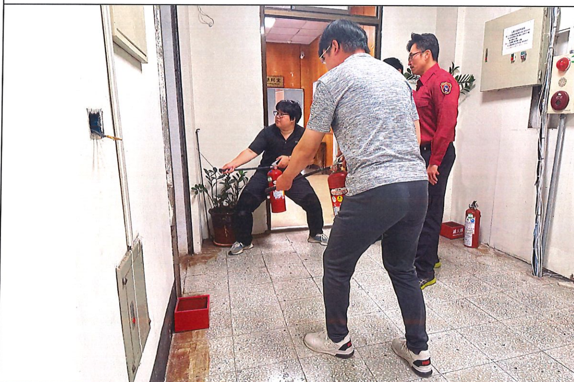
說明：初期滅火（滅火器或室內消防栓）情形