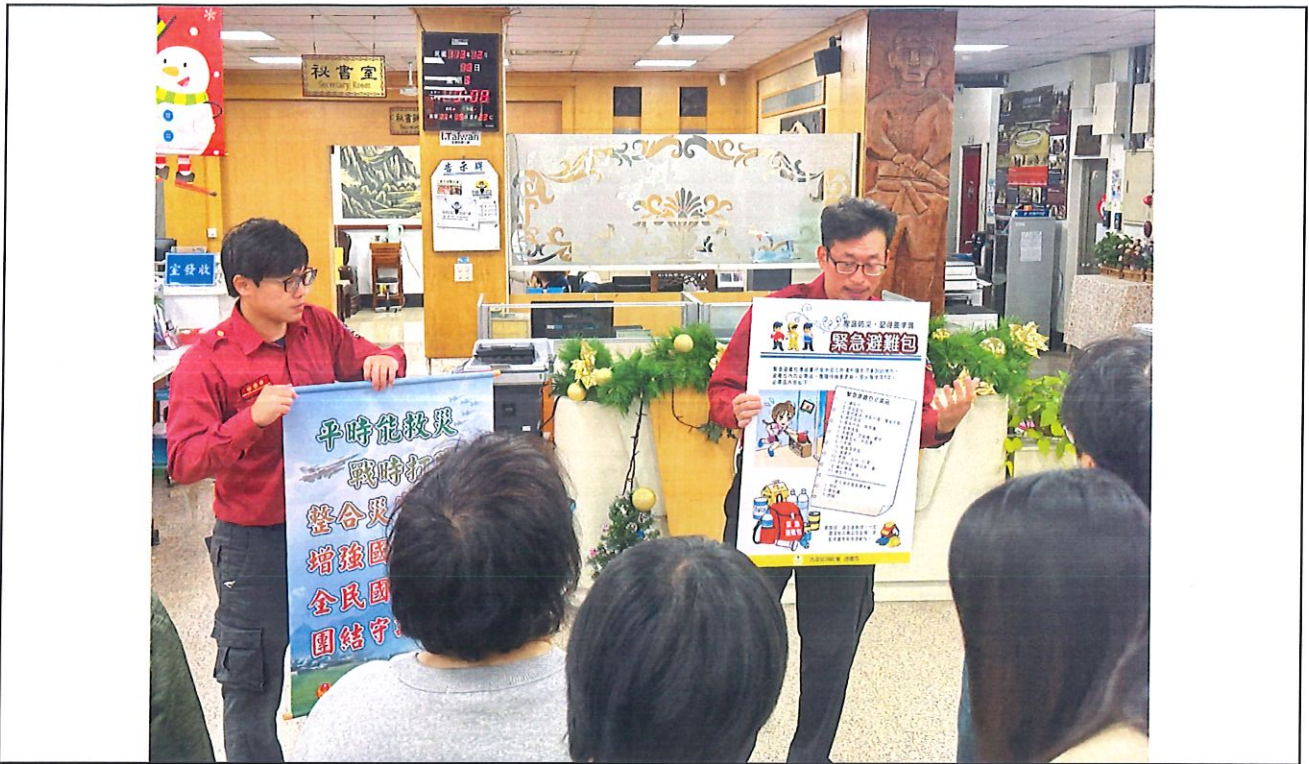
說明：防災或防震教育情形