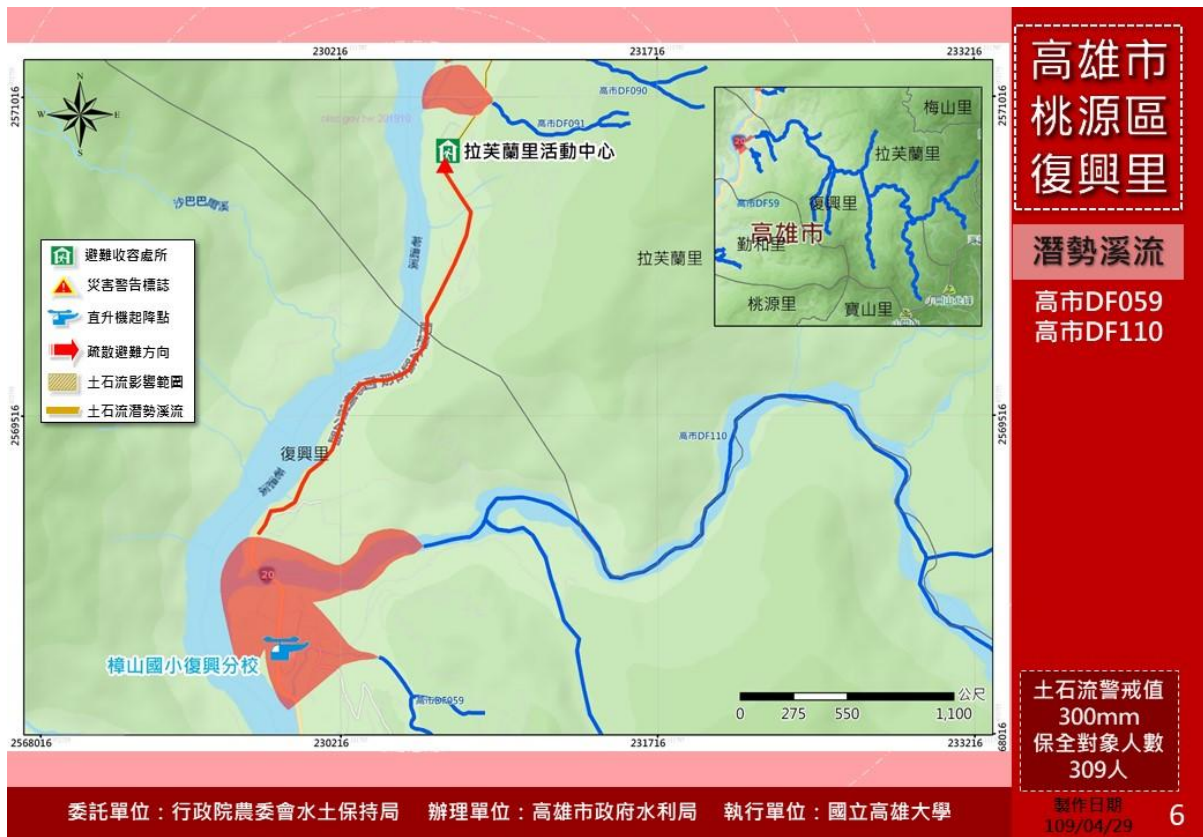
圖一 土石流疏散避難圖