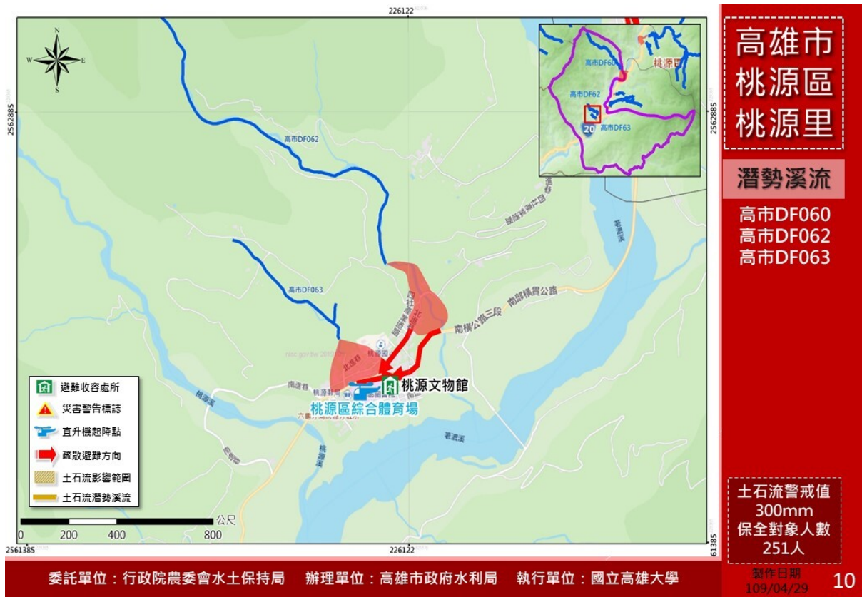
本里土石流疏散避難路線及避難地點圖示

委託單位：行政院農委會水土保持局 辦理單位：高雄市政府水利局 執行單位：國立高雄大學