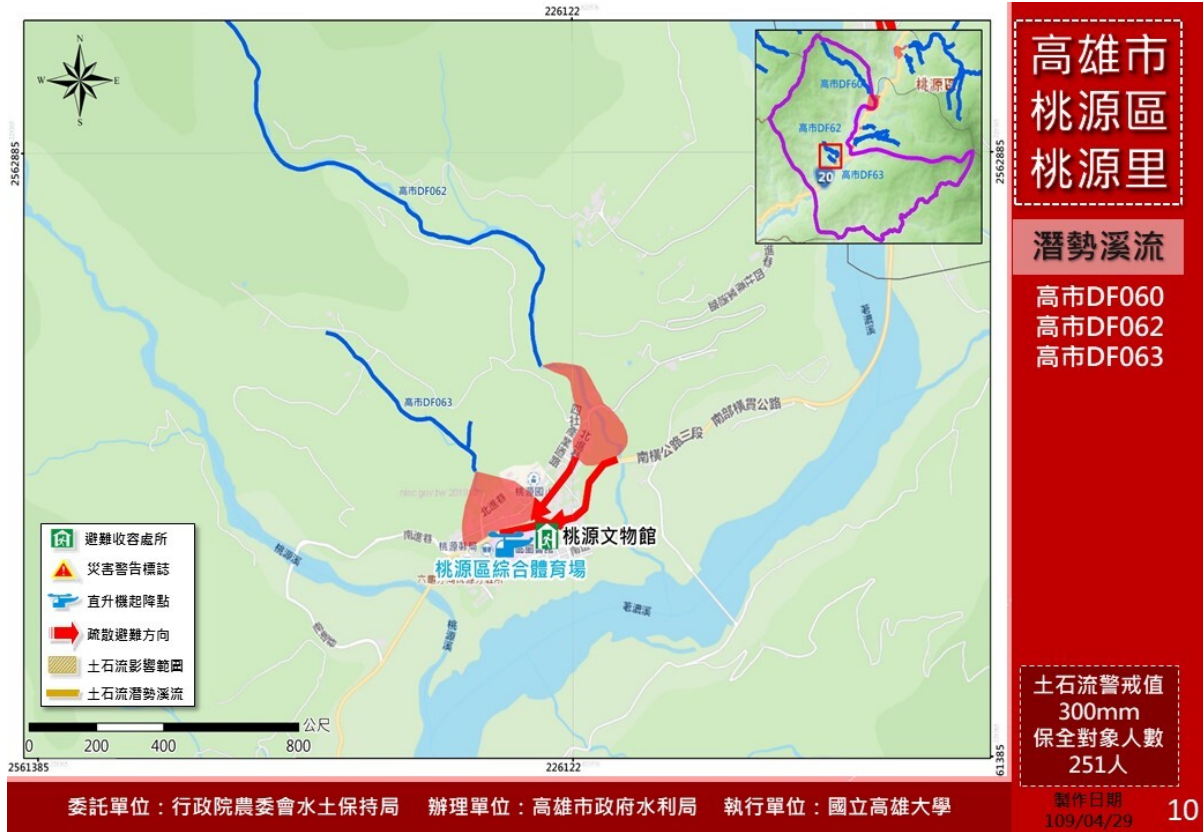
圖一 土石流疏散避難圖

委託單位：行政院農委會水土保持局 辦理單位：高雄市政府水利局 執行單位：國立高雄大學