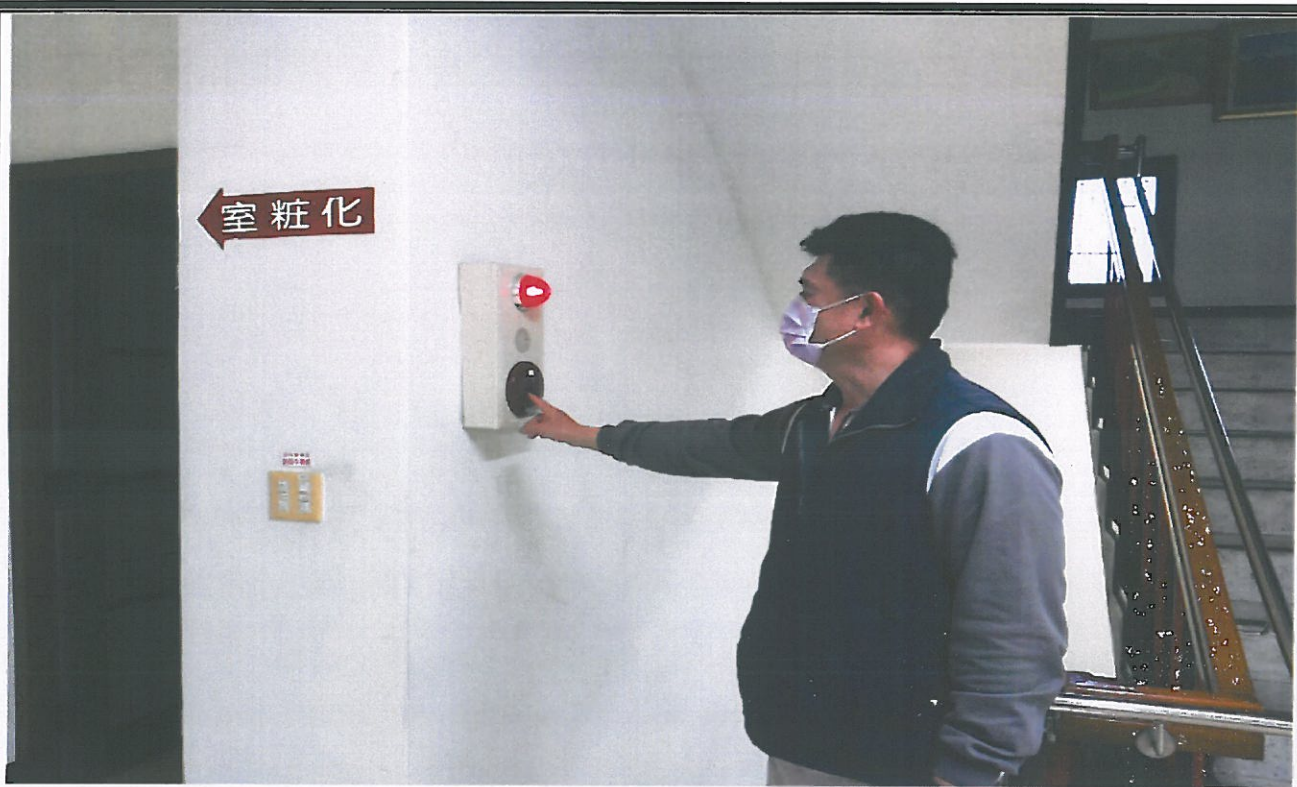
發現火災按下消防警鈴通知疏散、避難及滅火