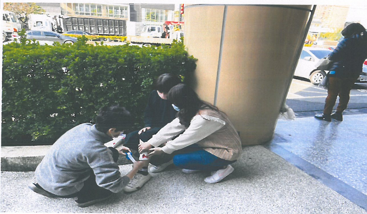
民眾受傷簡易包紮處置