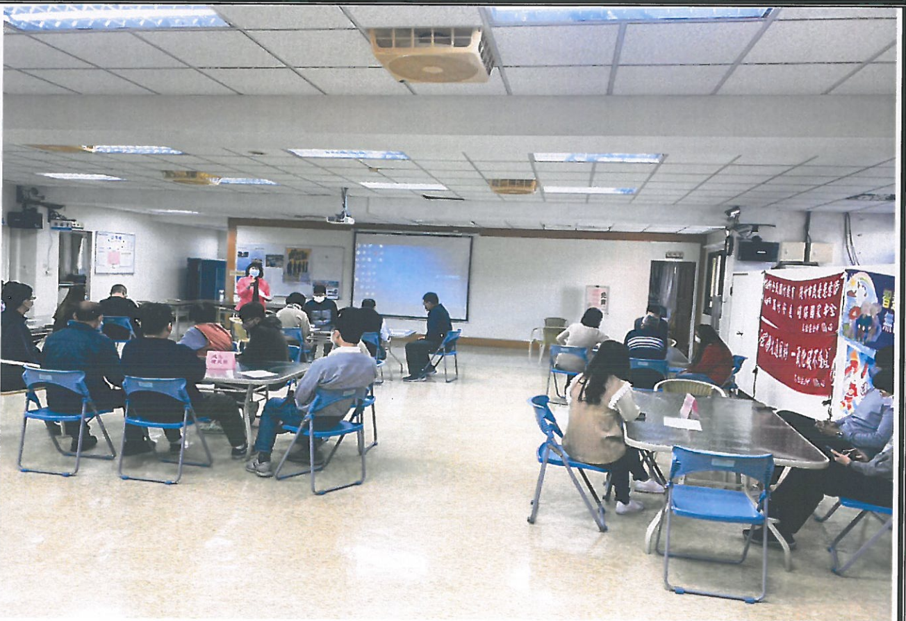
講授火災之預防、處置