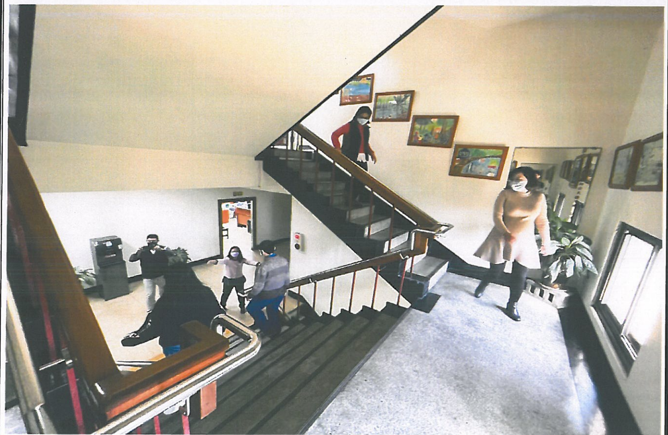
引導 3、4 樓民眾疏散