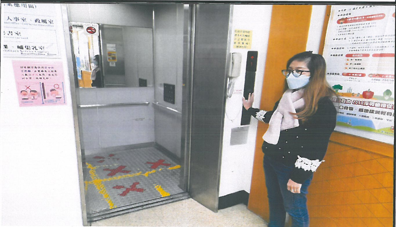
管制電梯至 1 樓並確認電梯內有無人員