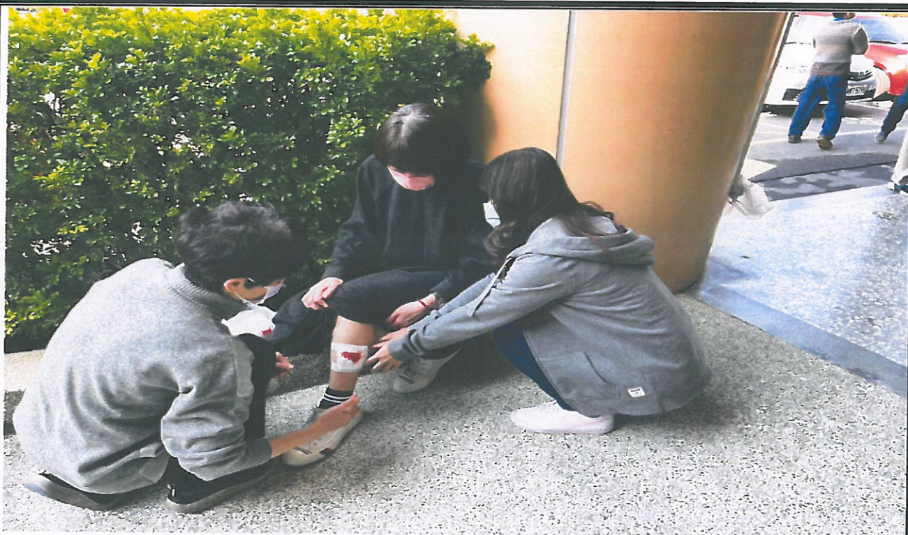
民眾受傷簡易包紮處置