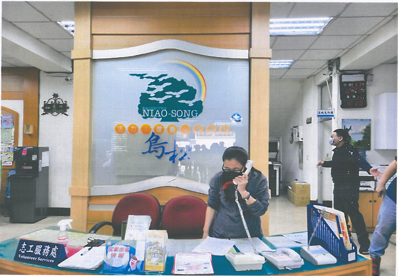
對外通報 119 發生火災現況