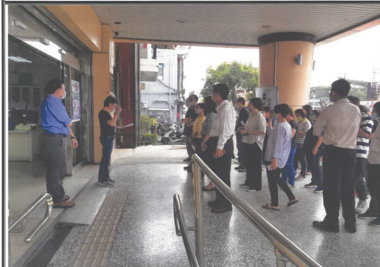
說明：召開檢討會議