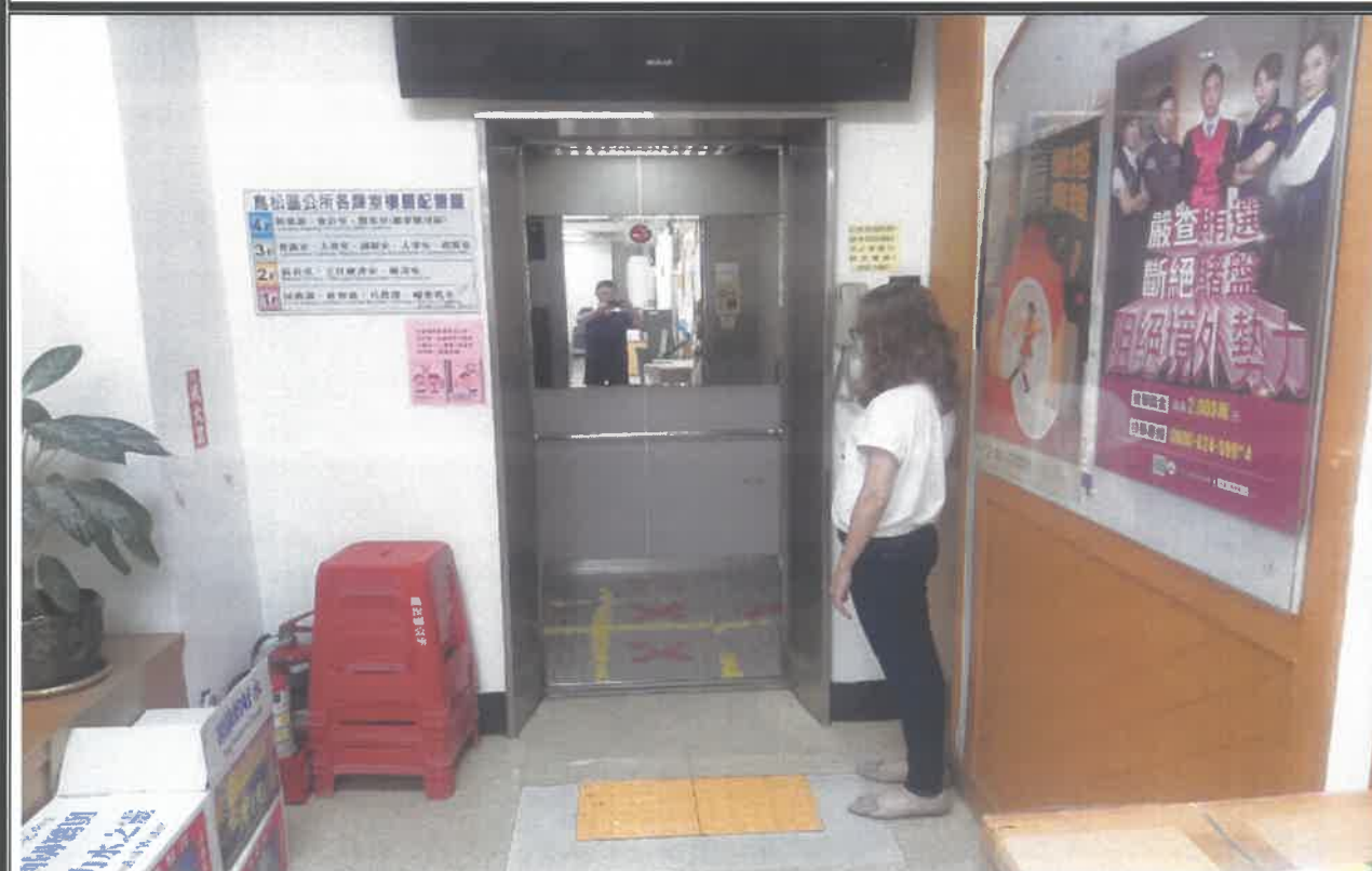
管制電梯至 1 樓並確認電梯內有無人員

說明：安全防護(50 人以上或現場如有電源、瓦斯，管制電梯或防火鐵捲門、防火門區劃等設備可由其他班人員兼任關閉確認)