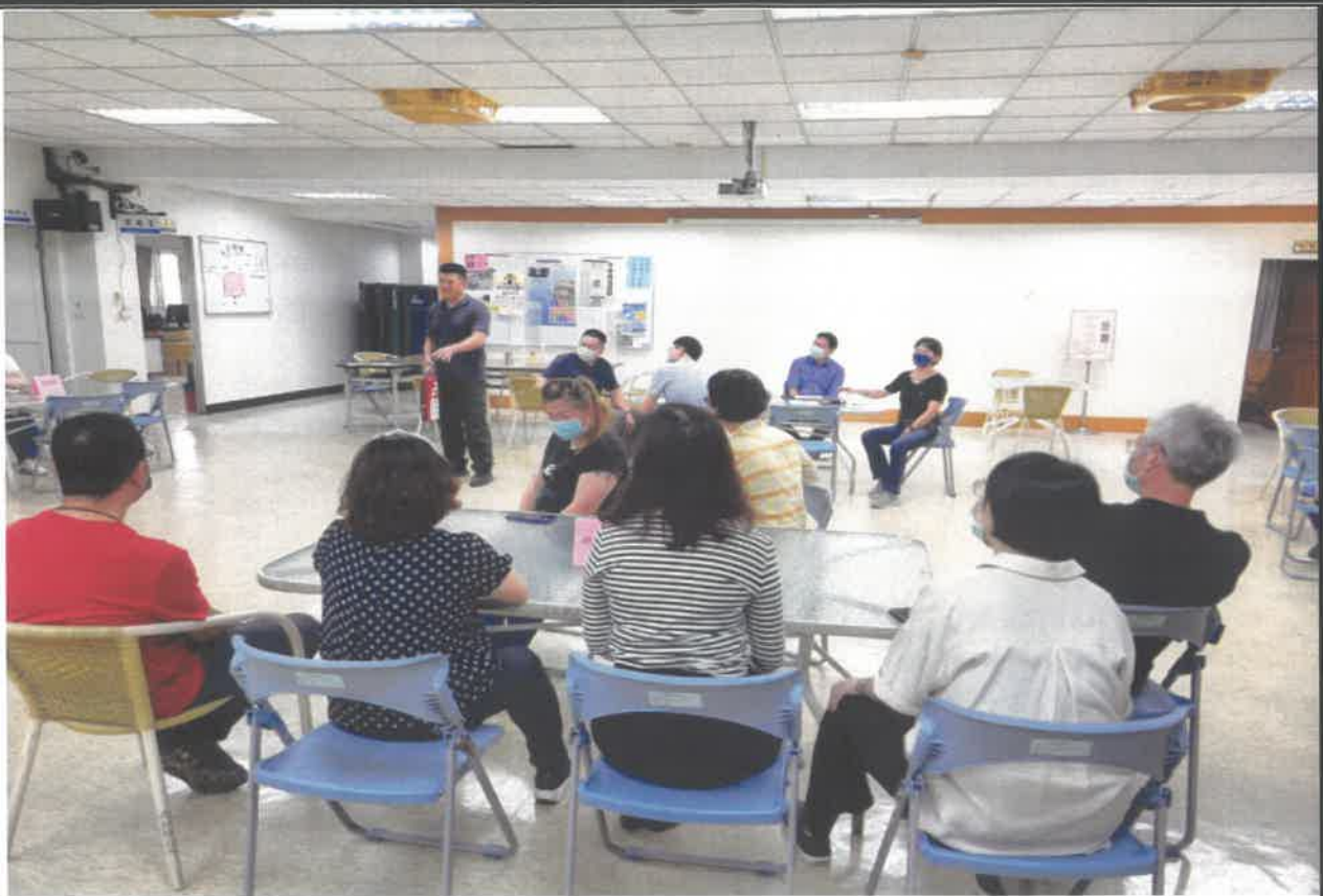
講授火災之預防、處置