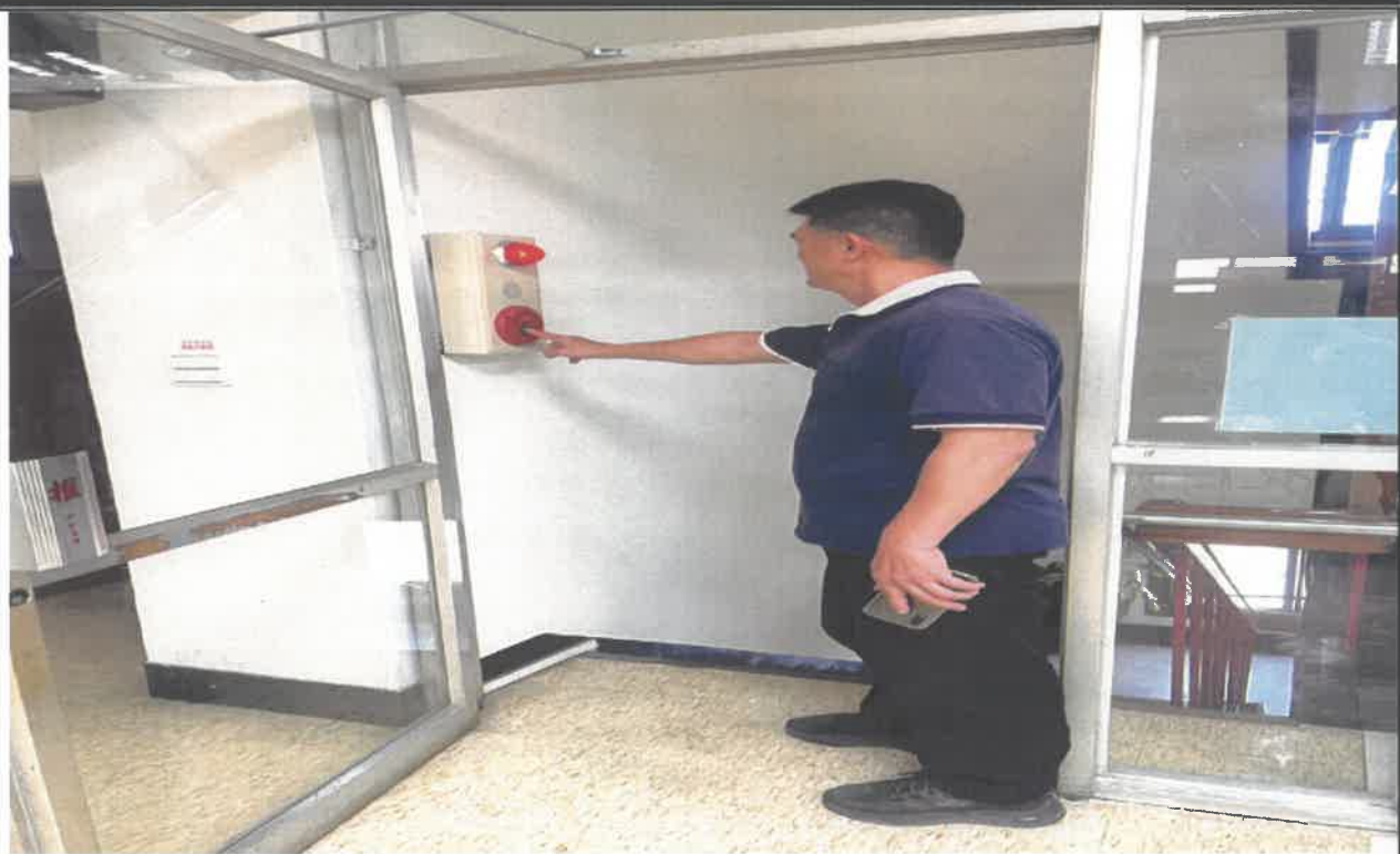
發現火災按下消防警鈴通知疏散、避難及滅火