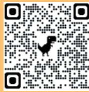
高雄星星兒基金會