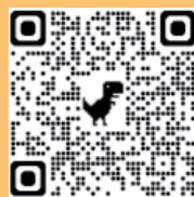
白永恩神父基金會