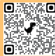
善慧恩慈善基金會