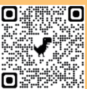
慈善團體聯合總會