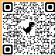
財團星星兒基金會