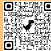
雷特氏症關懷協會