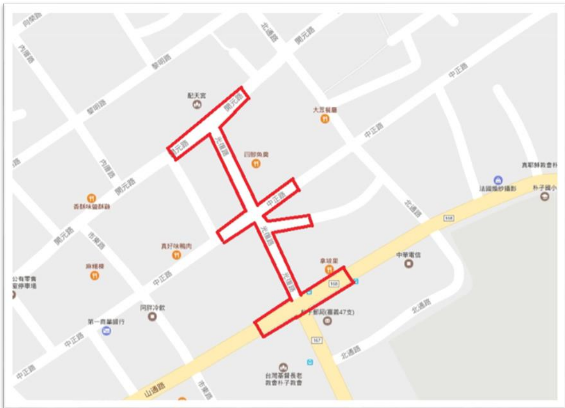
圖 2 朴子配天宮環境友善維護示範區範圍

(三)告示牌：本府將於朴子配天宮前及各對外路口（如前點所述）設置寺廟環境友善維護示範區解說告示牌。