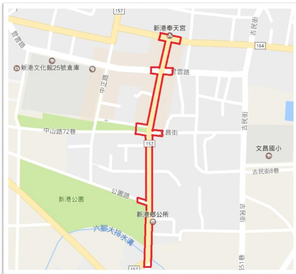
圖 1 新港奉天宮環境友善維護示範區範圍

(三)告示牌：本府將於新港奉天宮前及各對外路口(如前點所述)設置寺廟環境友善維護示範區解說告示牌。