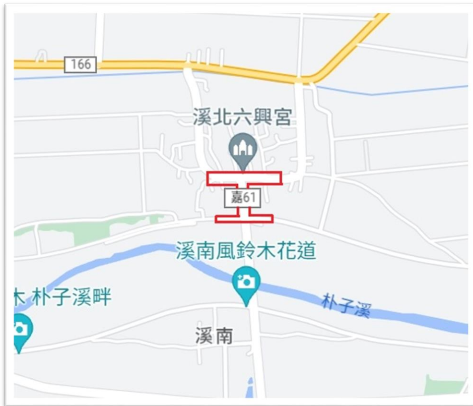
圖 3 溪北六興宮環境友善維護示範區範圍